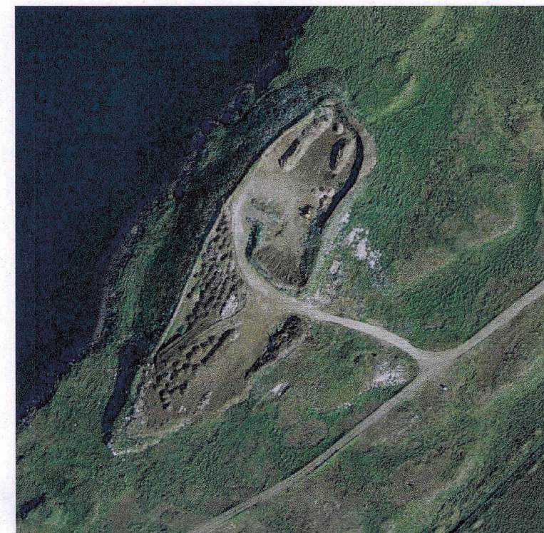
Mynd frá 2016 af urðunarstaðnum.

Aðalskipulagsbreyting þessi sem auglýst hefur verið skv. 2. mgr. 36. gr. skipulagslaga nr. 123/2010 var samþykkt í bæjarstjórn þann 13. Mars 2019.