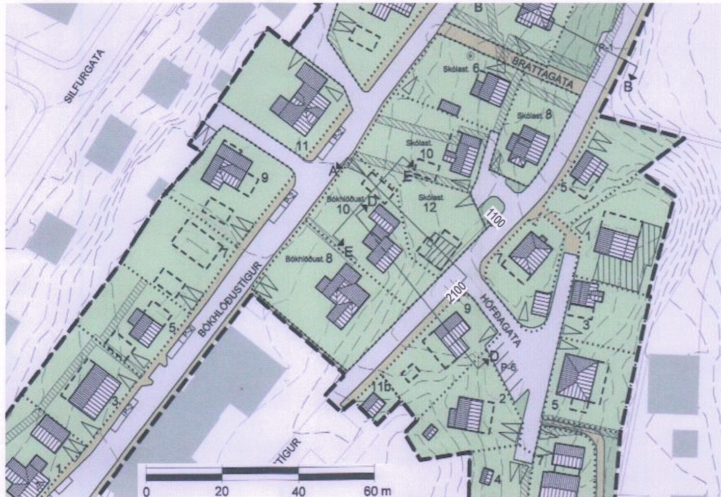
hluti af deiliskipulagsupprætti