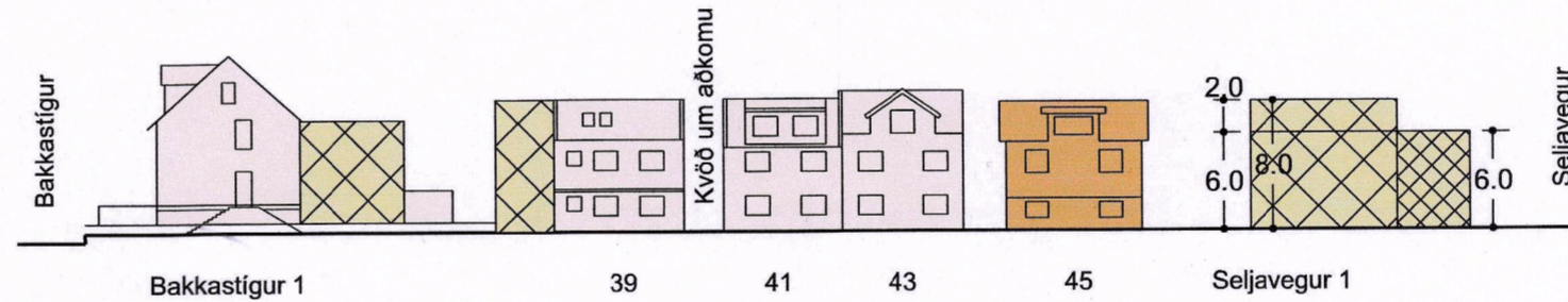
Tillaga að breyttu deiliskipulagi, götamynd, Nýlendugata til norðurs, MKV. 1:500