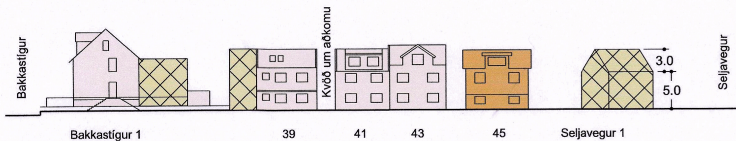
Gildandi deiliskipulag, götamynd, Nýlendugata til norðurs, MKV. 1:500

Endurskoðun A: 21.02. 2020, uppráttur lagfærður.