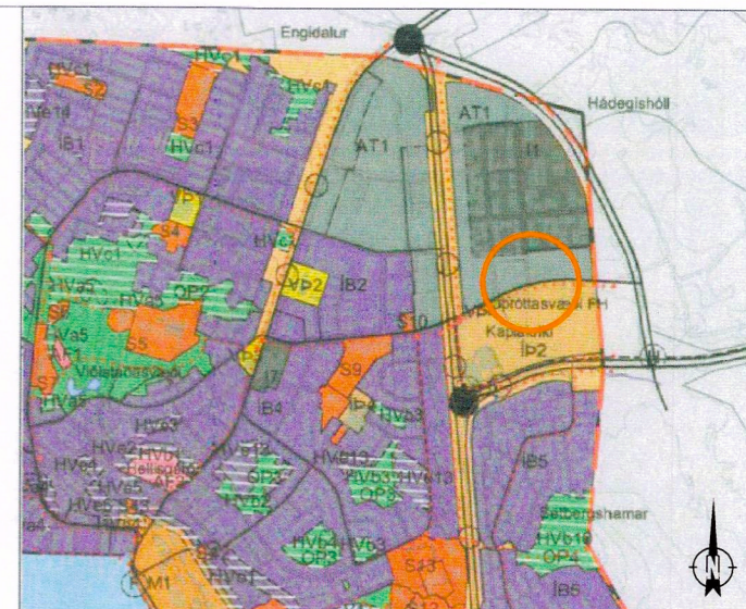
HLUTI AÐALSKIPULAGS HAFNARFJARÐAR 2013 - 2025