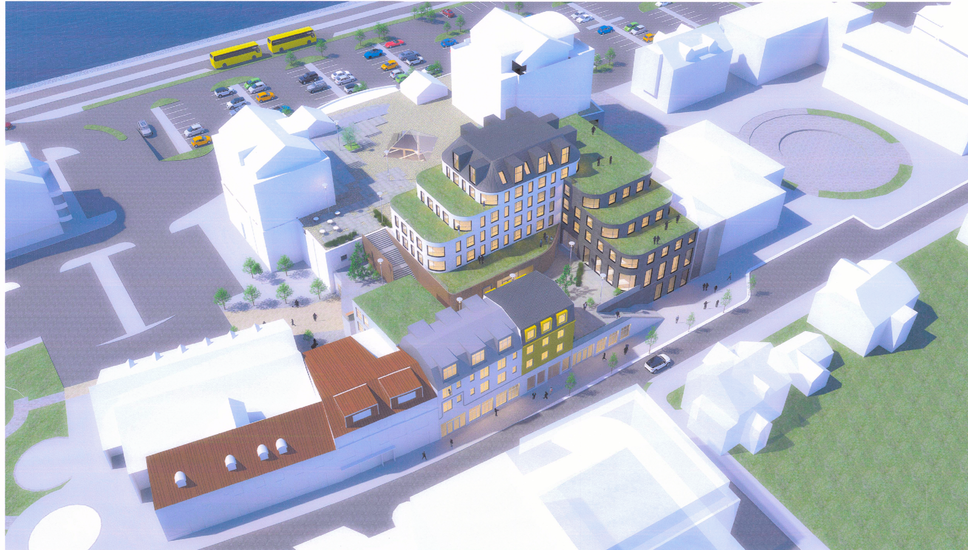
Skýringarmynd - séð úr lofti