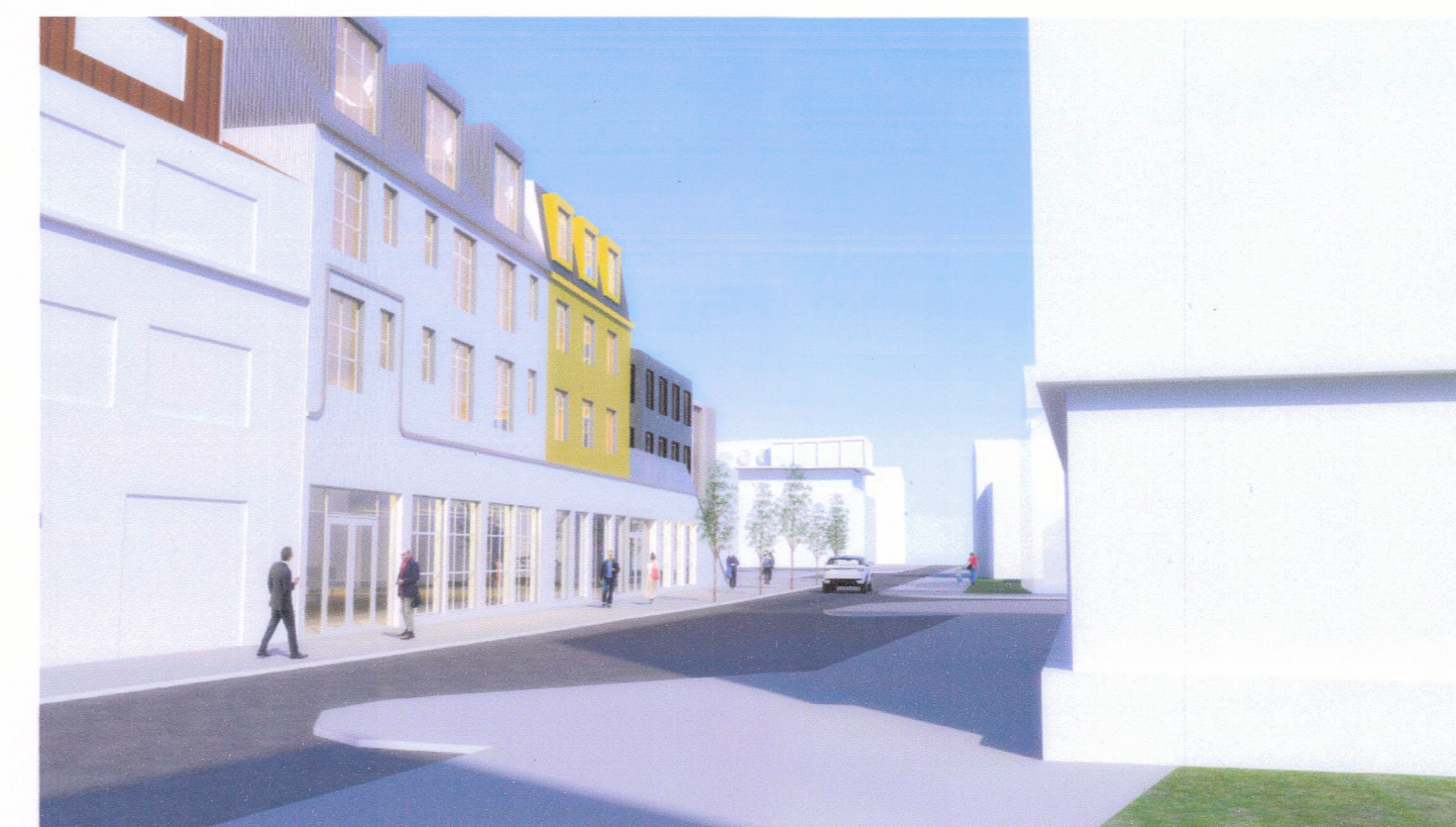
Skýringarmynd - horft norður Strandgötu