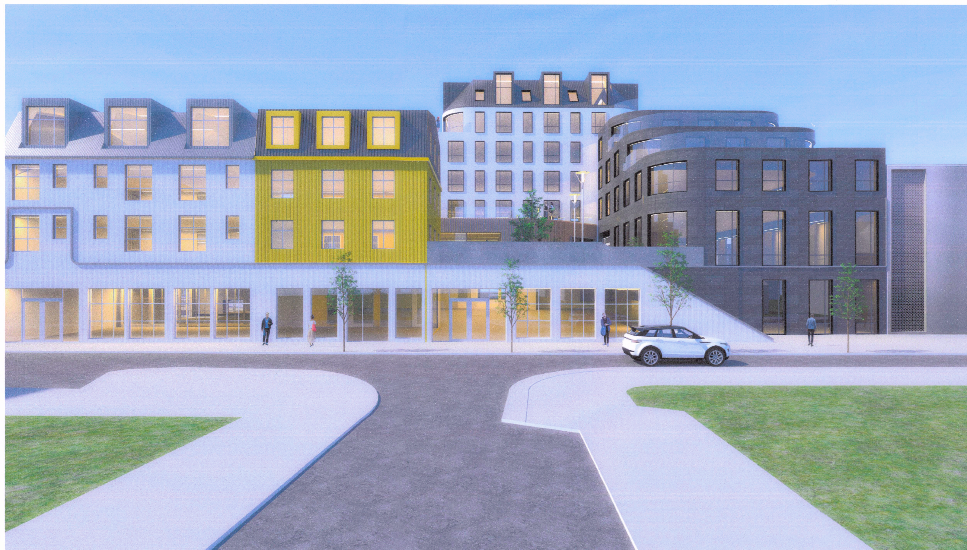
Skýringarmynd - horft niður Gunnarsbraut