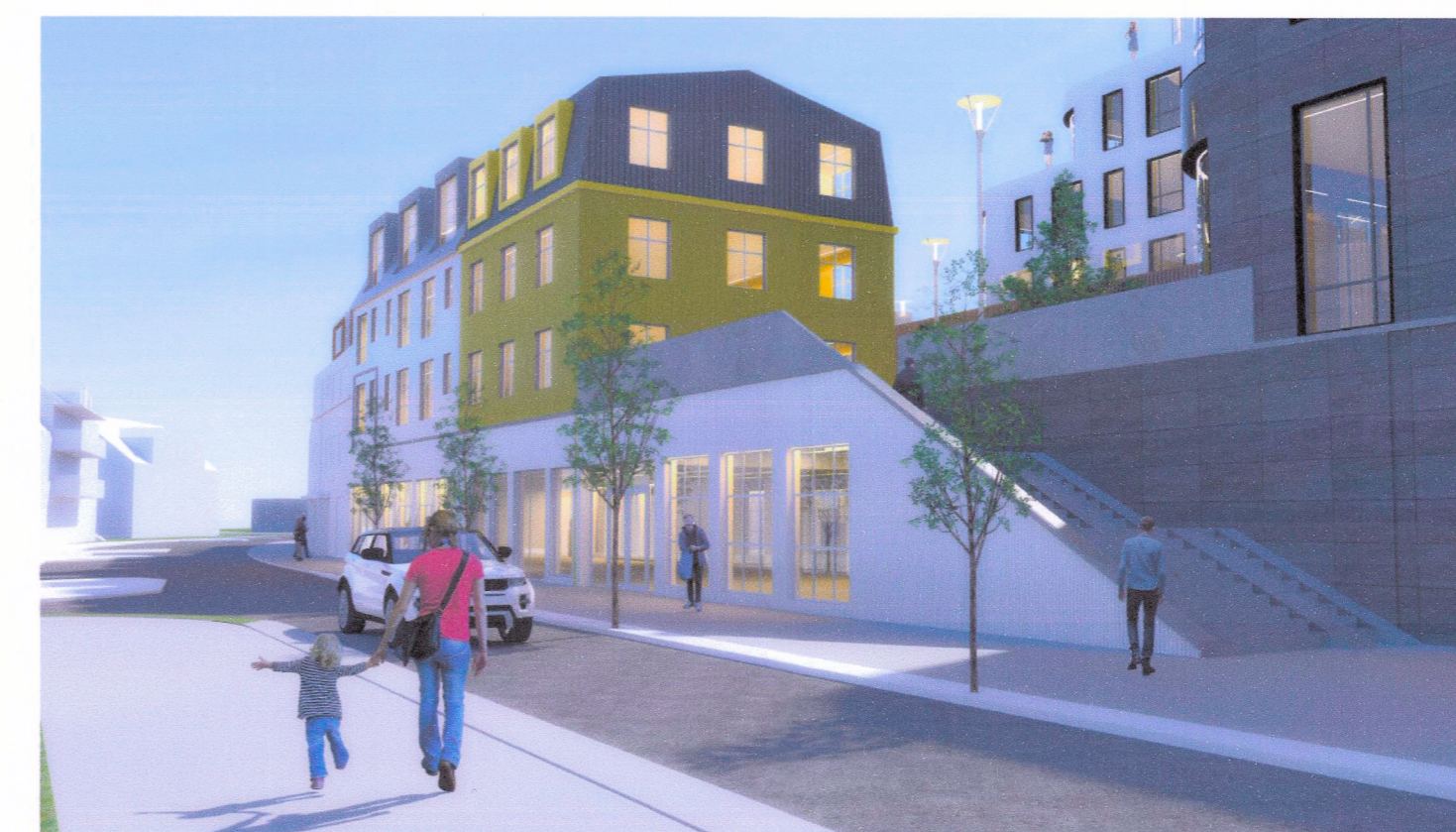
Skýringarmynd - horft suður Strandgötu