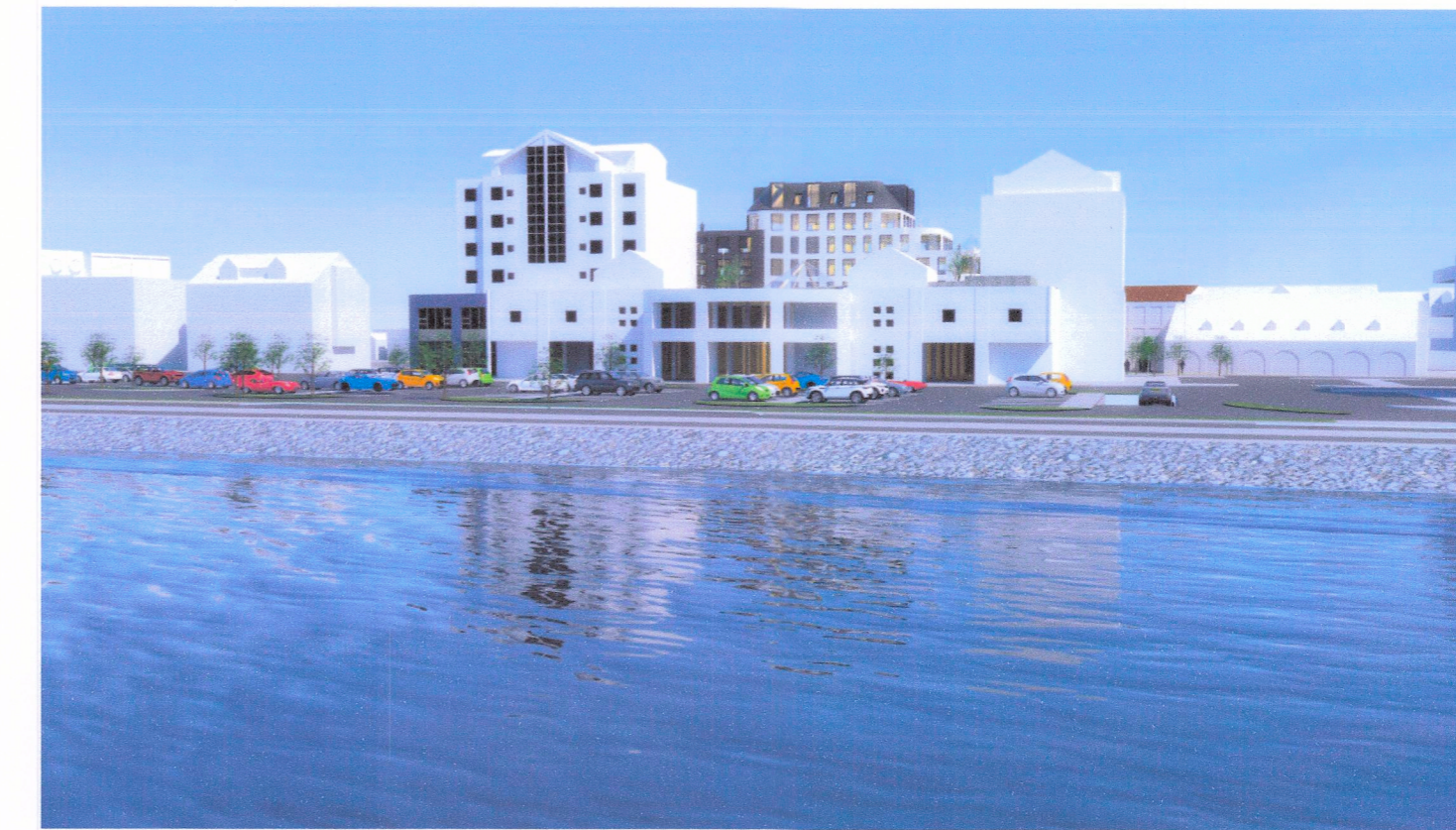
Skýringarmynd - séð frá höfn