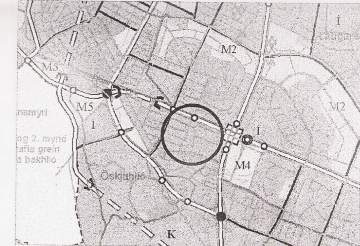
Aðalskipulag Reykjavíkur 2001-2024