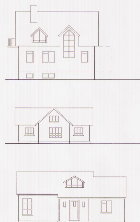
Algengar gerðir einbýlishúsa 1:250