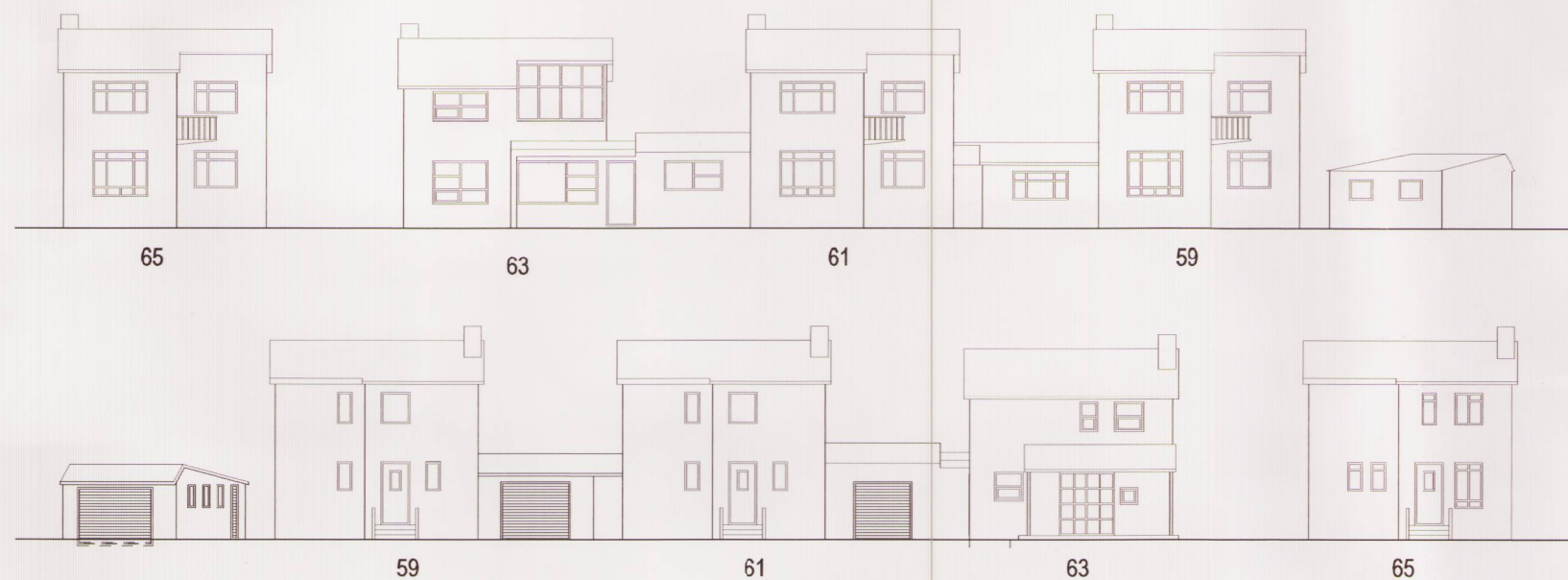
Heiðargerði 59 - 65 götumynd sem hefur gildi sem heilleg götumynd frá 6. áratugnum. 1:250.