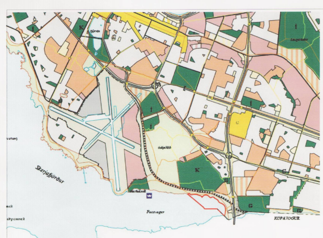
Aðalskipulag Reykjavíkur 1996-2016