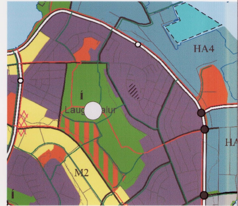
Aðalaskipulag 2001-2024 staðsetn.