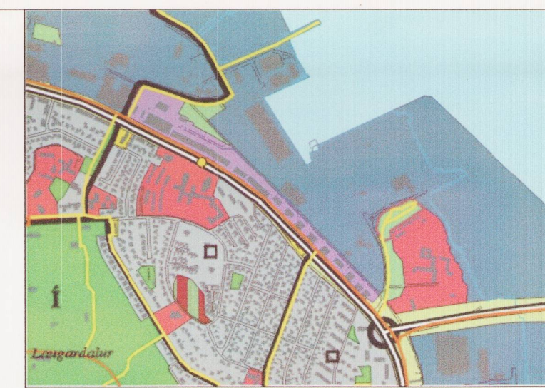
GILDANDI AÐALSKIPULAG MKV. 1:15.000

Að öllu öðru leyti gilda eldri skipulagsskilmálar sem samþykktir voru í skipulags- og byggingarnefnd þann 12.nóv. 2003 og í borgarráði þann 16. des. 2003.