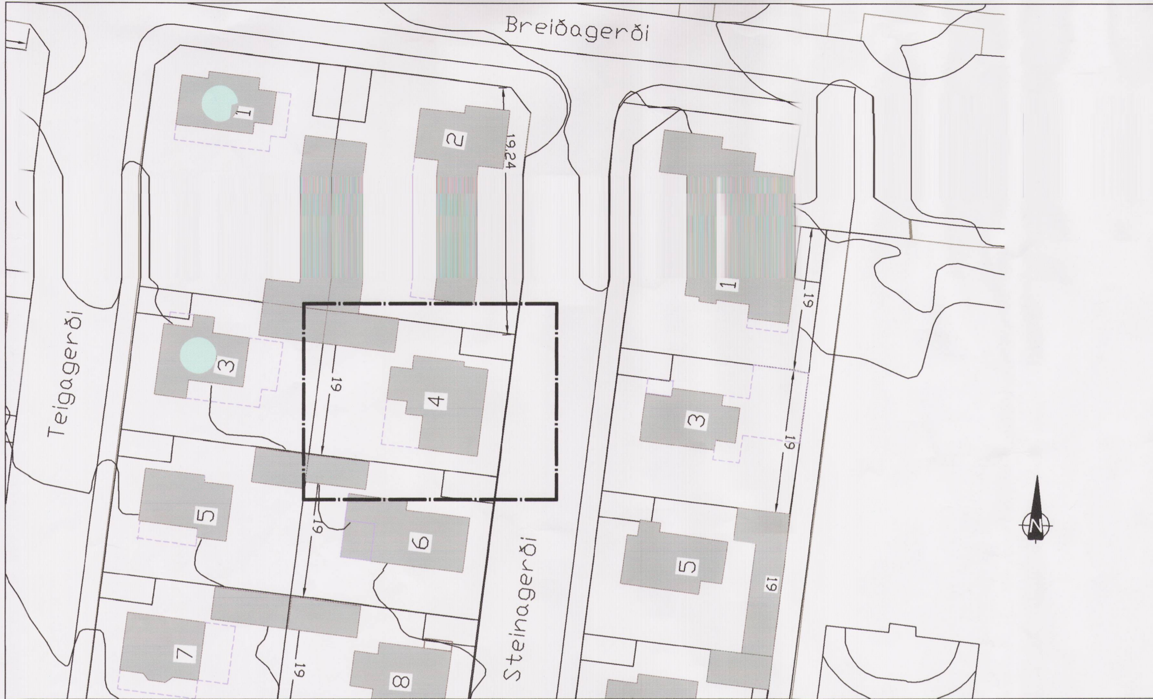
Gildandi deiliskipulag m. 1:500