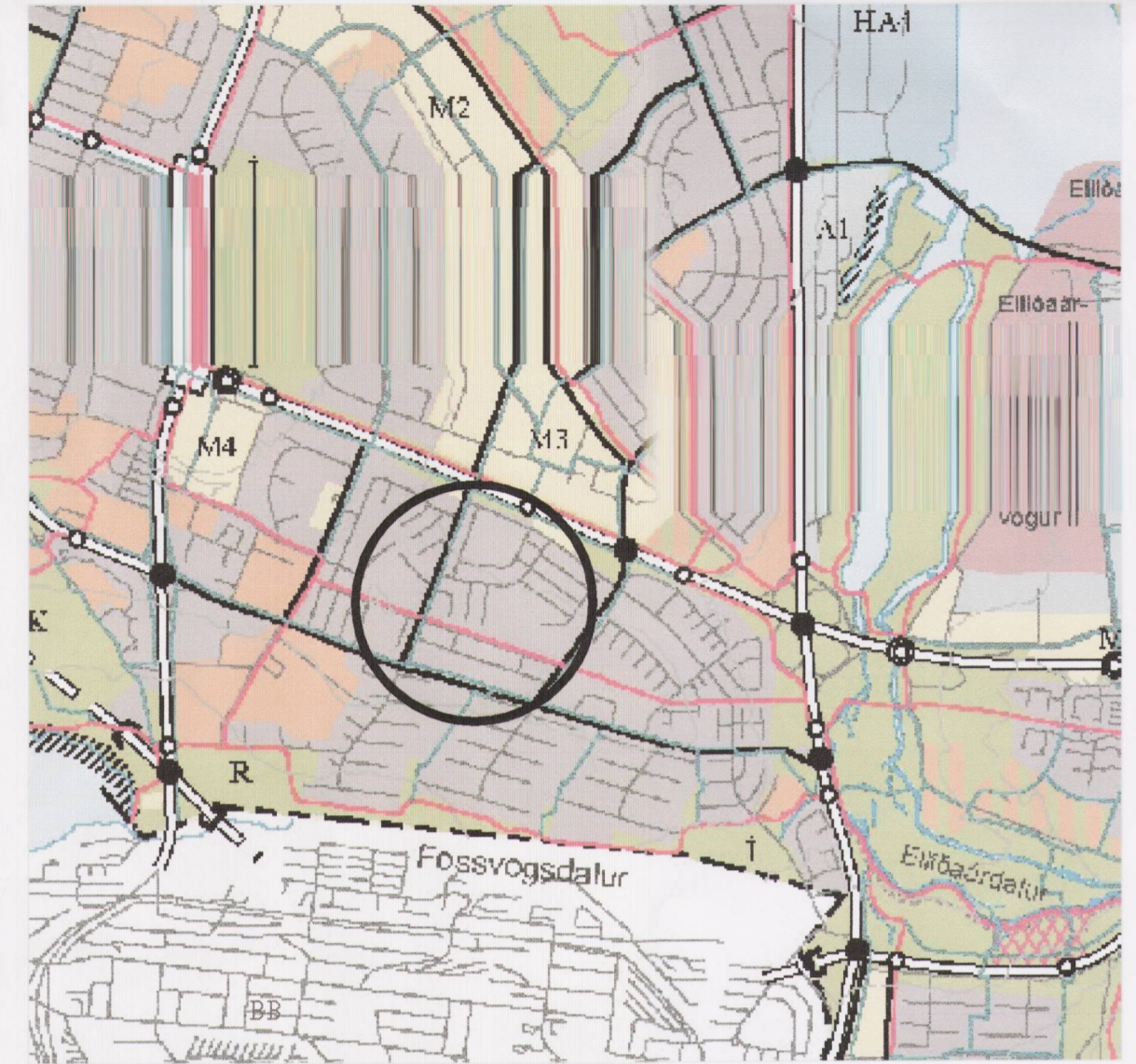
AÐALSKIPULAG REYKJAVÍKUR 2001 - 2024