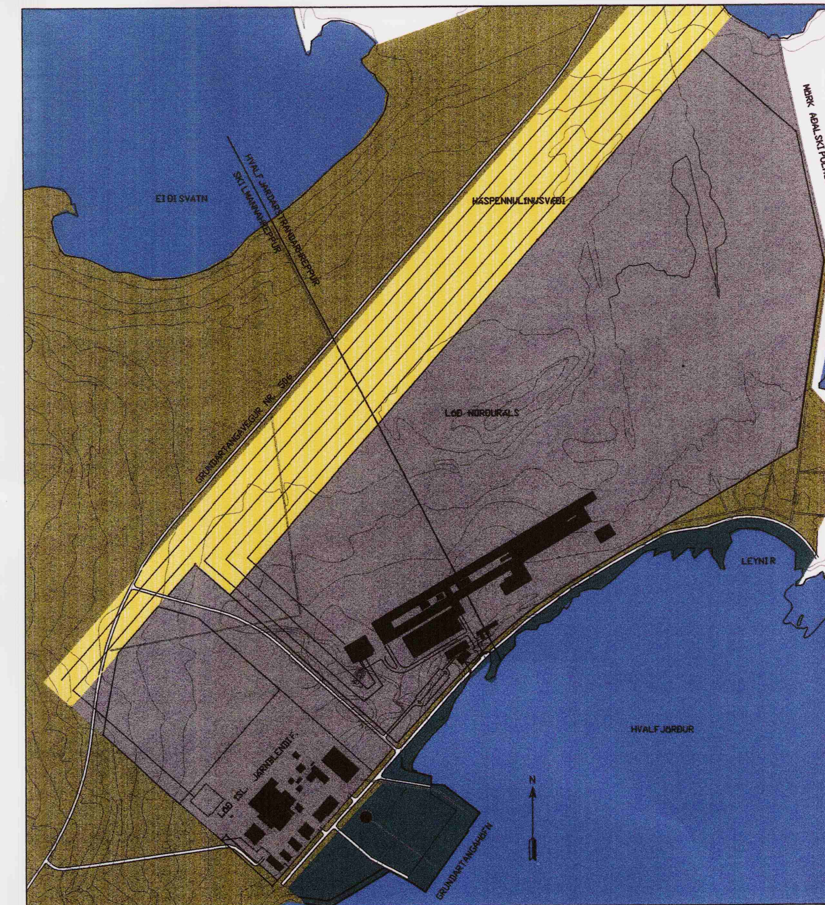
BREYTT ADALSKIPULAG IÐNADARSVÆÐIS Á GRUNDARTANGA 1997-2017. MKV. 1:10.000 GERT Í DESEMBER 2003