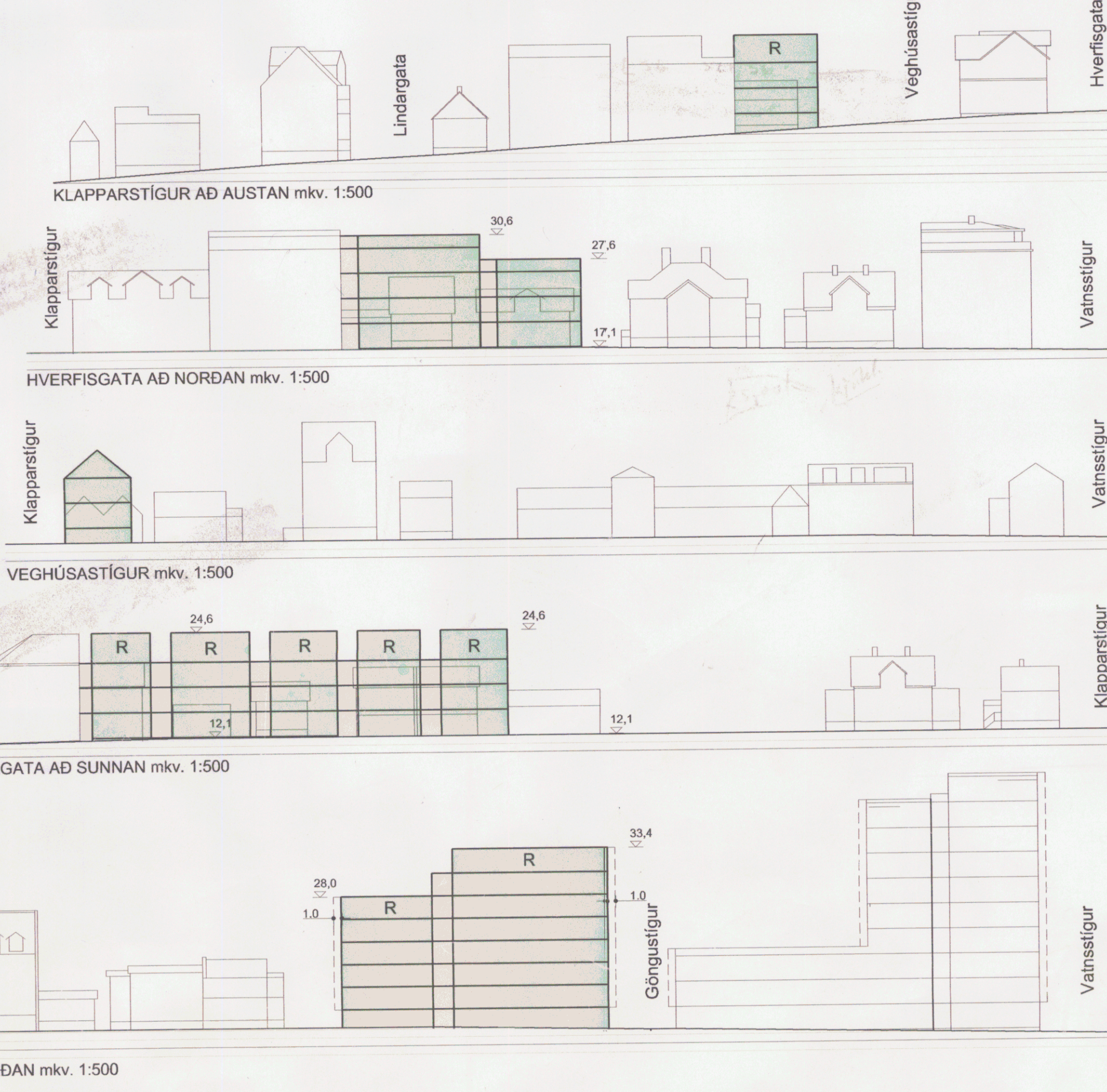
LINDARGATA AD NORDAN mkv. 1:500