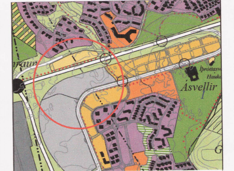
Aðalskipulag Hafnarfjarðar 2005 - 2025 Staðsetning skipulagssvæðis