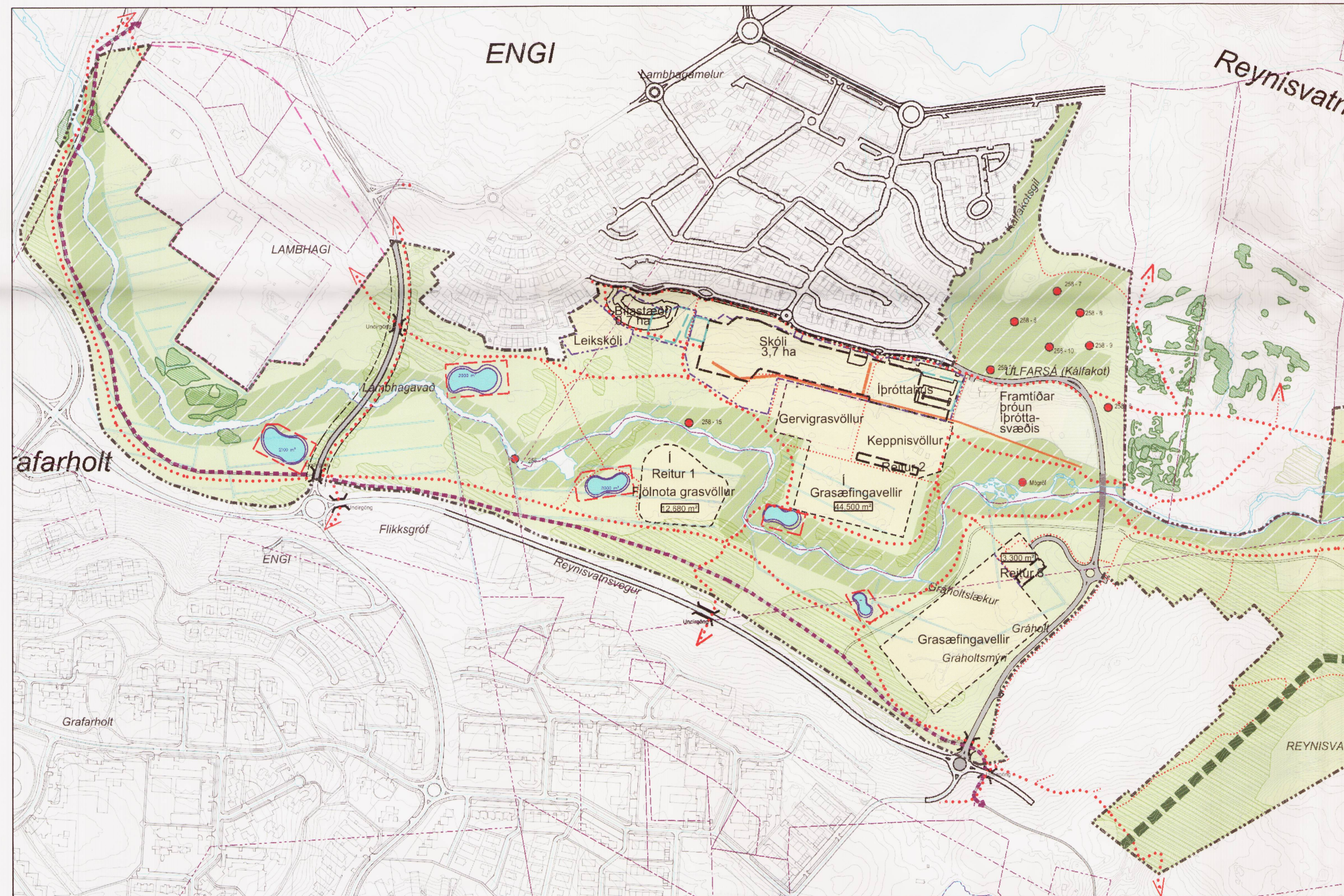
Yfirlitsmynd af deiliskipulagsbreytingu, suðvestur hluti deiliskipulag útivistarsvæði Úlfarsárdals. Mkv. 1:5000