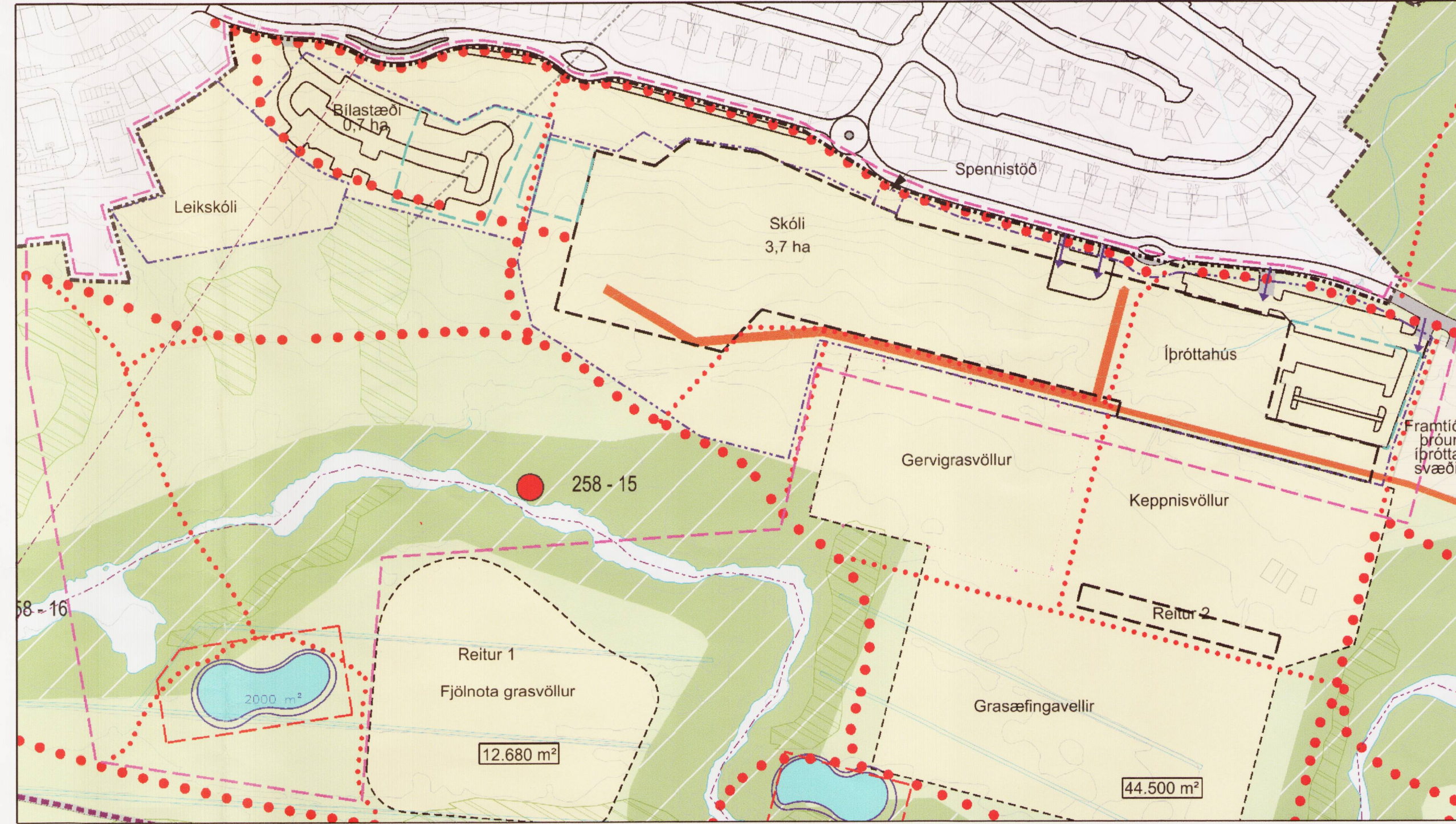
Breyting á deiliskipulagi í desember 2015, mkv. 1:2000