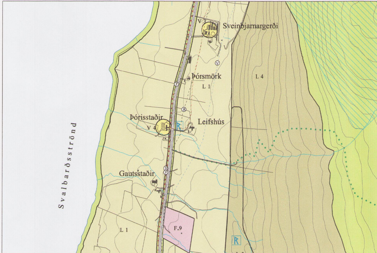
Staðfest aðalskipulag 5.9.2008