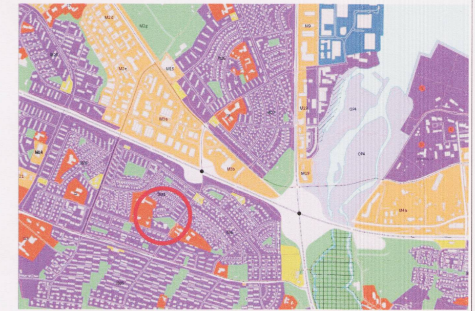
Úrdráttur úr Aðalskipulagi Reykjavíkur 2010-2030

Deiliskipulagsbreyting þessi sem fengið hefur meðferð í samræmi við ákvæði 1. mgr. 43. gr. skipulagslaga nr. 123/2010