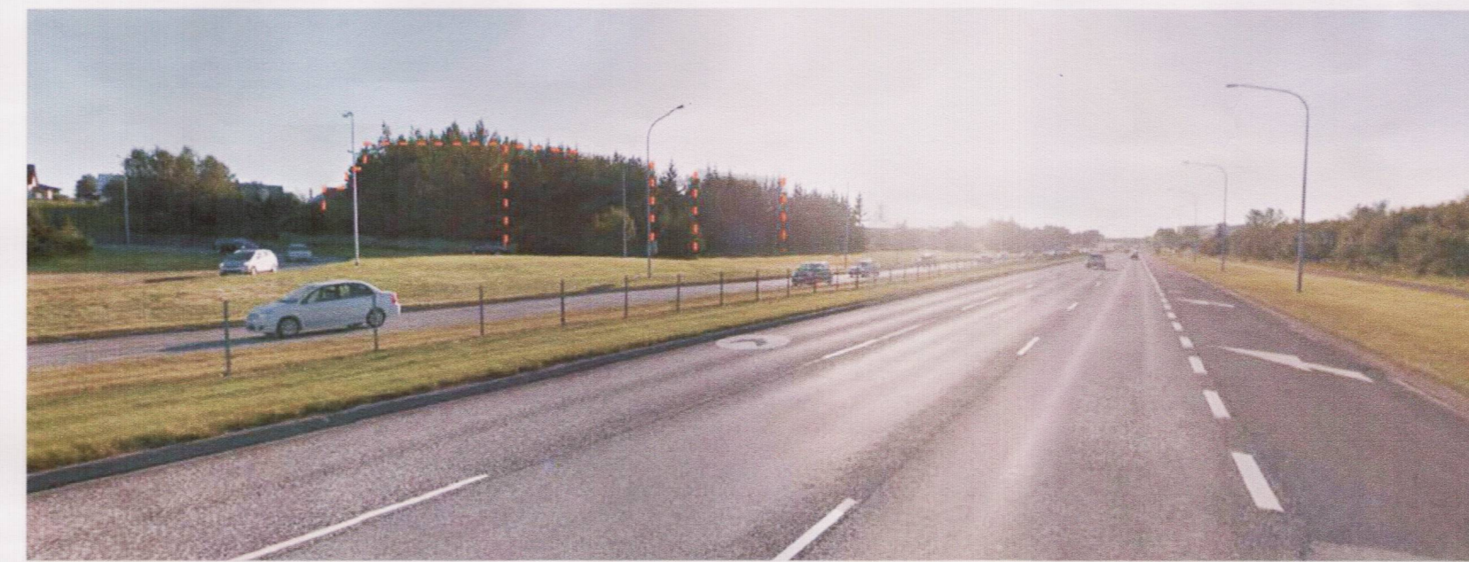
Séð vestur Miklubraut