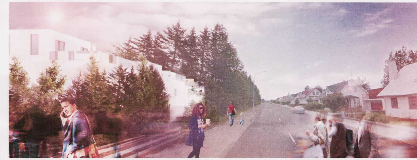
Massamódel séð austur Sogaveg