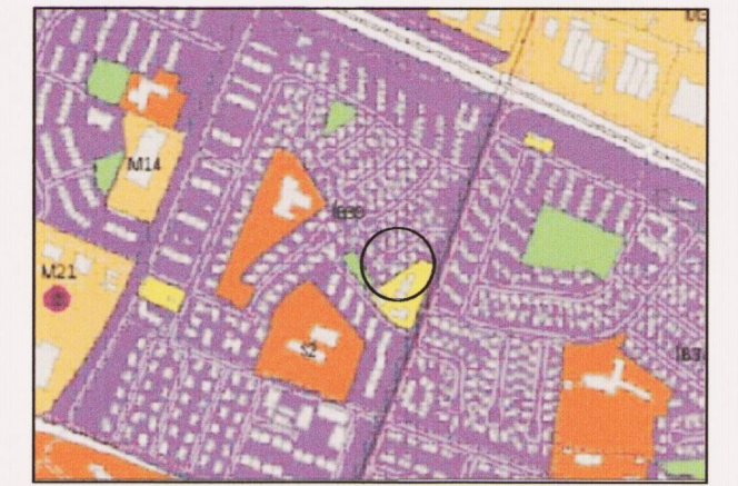
Hluti af Aðalskipulagi Reykjavíkur 2010-2030

Deiliskipulagsbreyting þessi sem fengið hefur meðferð í samræmi við