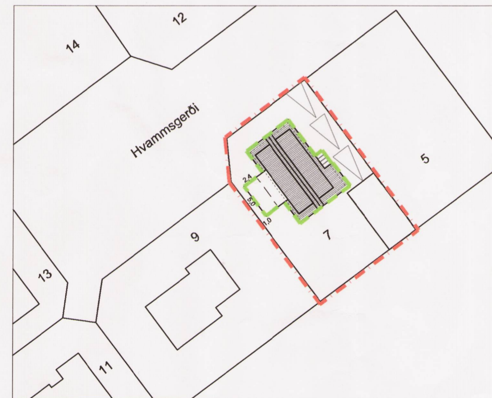
Skýringamynd Mkv. 1:500