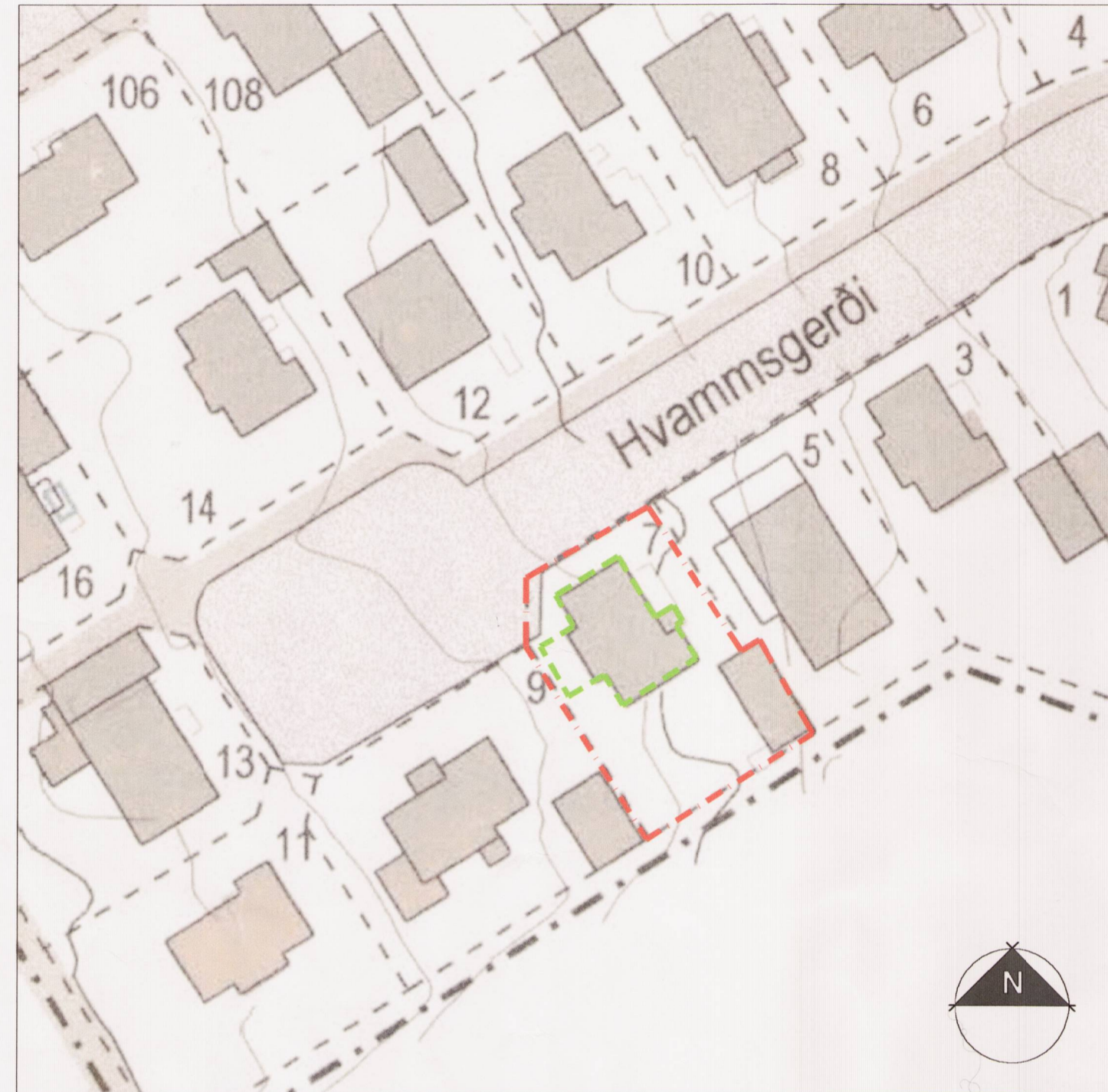
Tillaga að breytingu á deiliskipulagi vegna Hvammsgerði 7. Mkv. 1:500

Að öðru leyti gilda núverandi skilmálar.