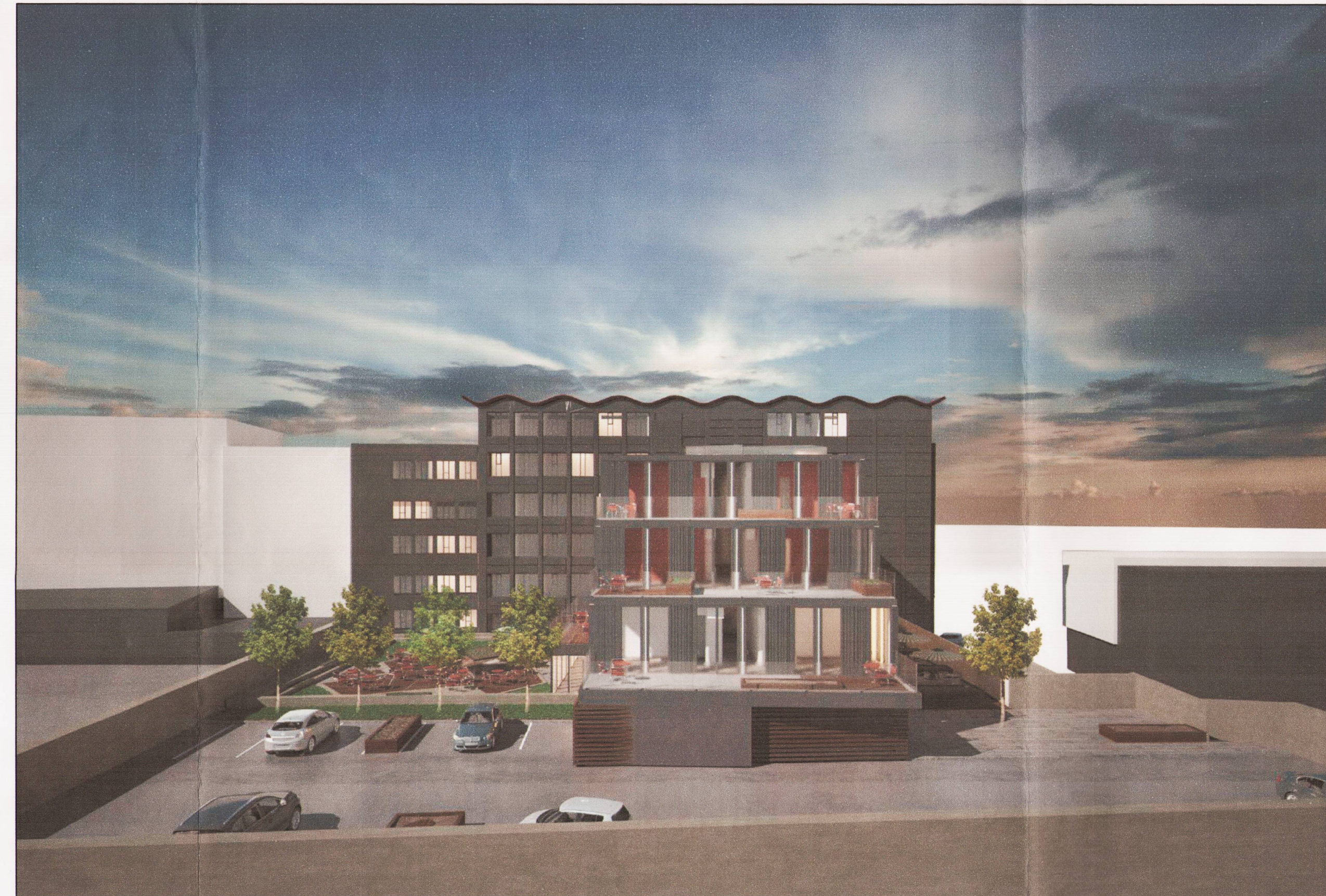
Tillaga að ásynd Suður