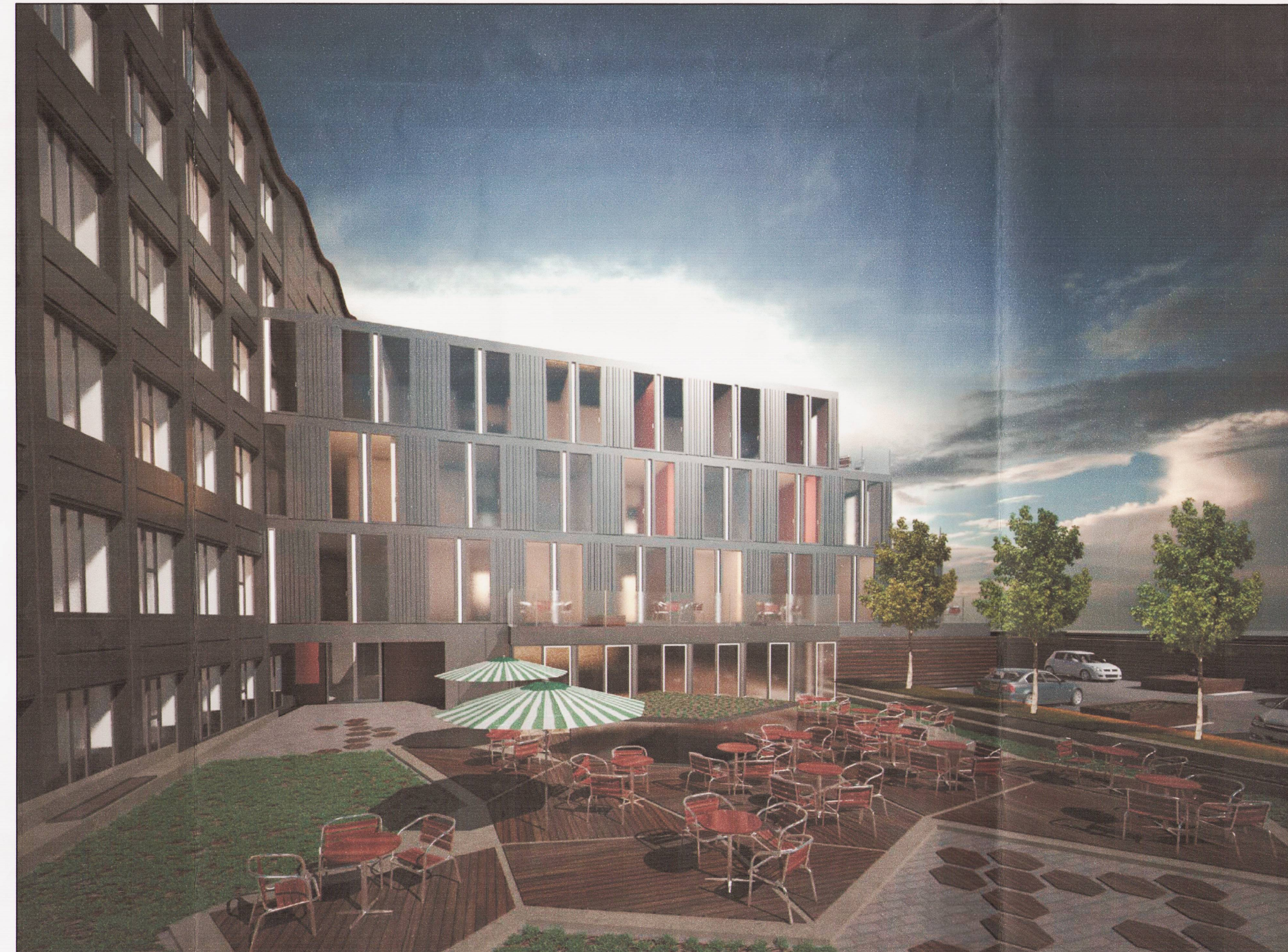
Liflegur og bjartur bakgarður fyrir gesti og gangandi.

Deiliskipulagsbreyting þessi sem fengið hefur meðferð í samræmi við ákvæði 1. mgr. 43. gr. skipulagslaga nr. 123/2010 var samþykkt í Deiliskipulagsráði þann 5.10.2017 og á embætti skipul. fulltr. þann 1.12.2017