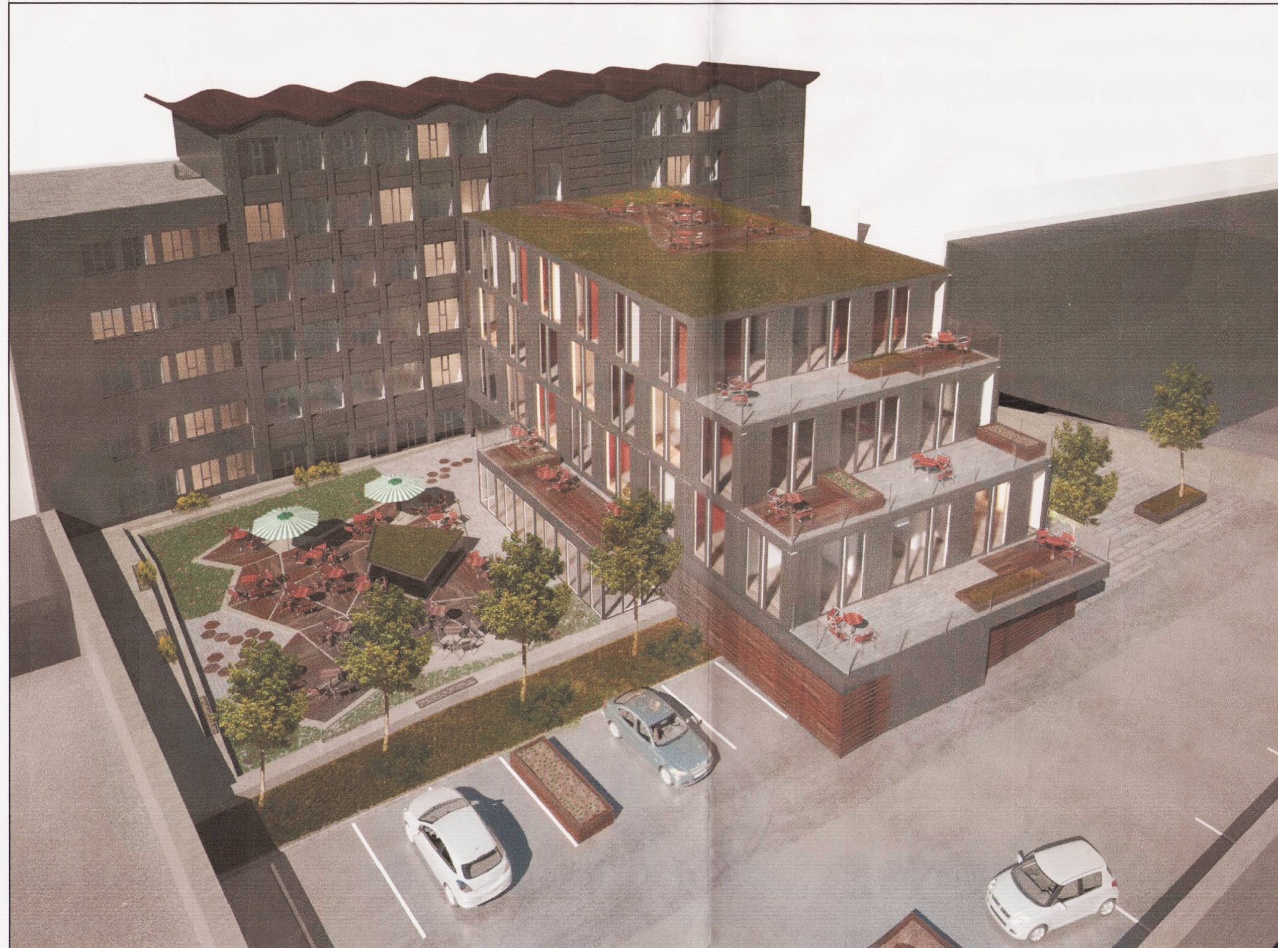
Skjólgóð útisvæði í suður og þaksvalir.