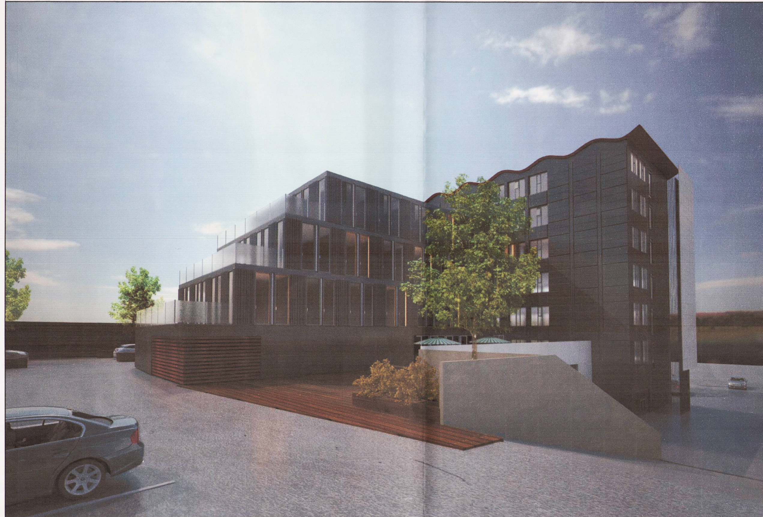
Tillaga að ásynd Suð-austur