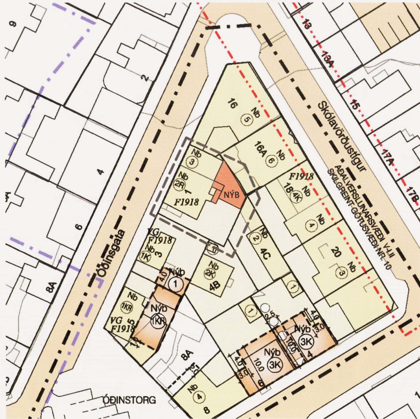
GILDANDI DEILISKIPULAGI REITUR 1.181.0 SAMÞYKKT Í BORGARRÁÐI 4.2.2003 - MEÐ BREYTINGU SAMÞ. 26.10.2012 Á AFGREIÐSLUFUNDI SKIPULAGSSTJÓRAEMBÆTTIS 1:500