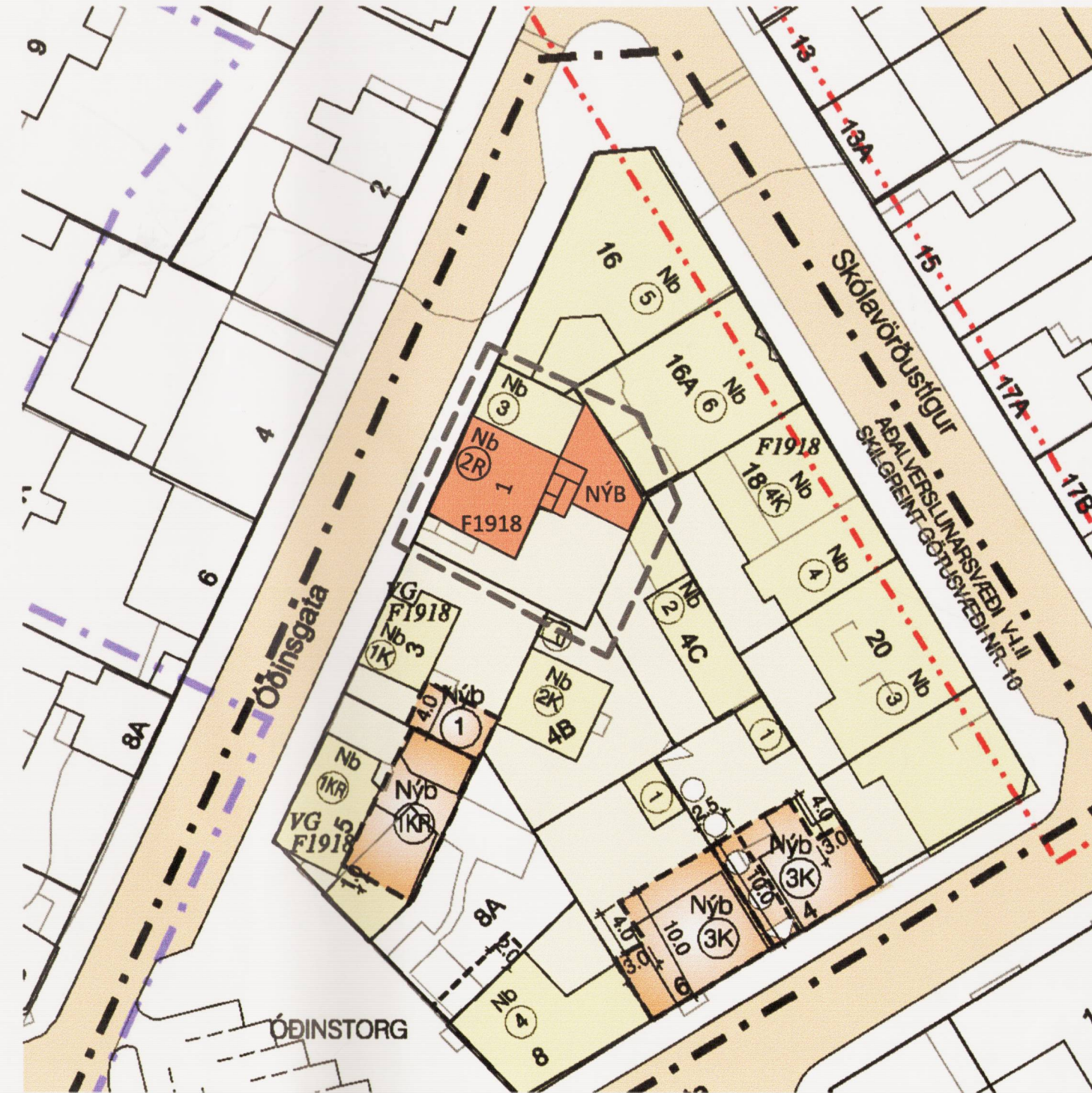
TILLAGA AÐ BREYTTU DEILISKIPULAGI - ÓÐINGSGATA 1 MKV. 1:500