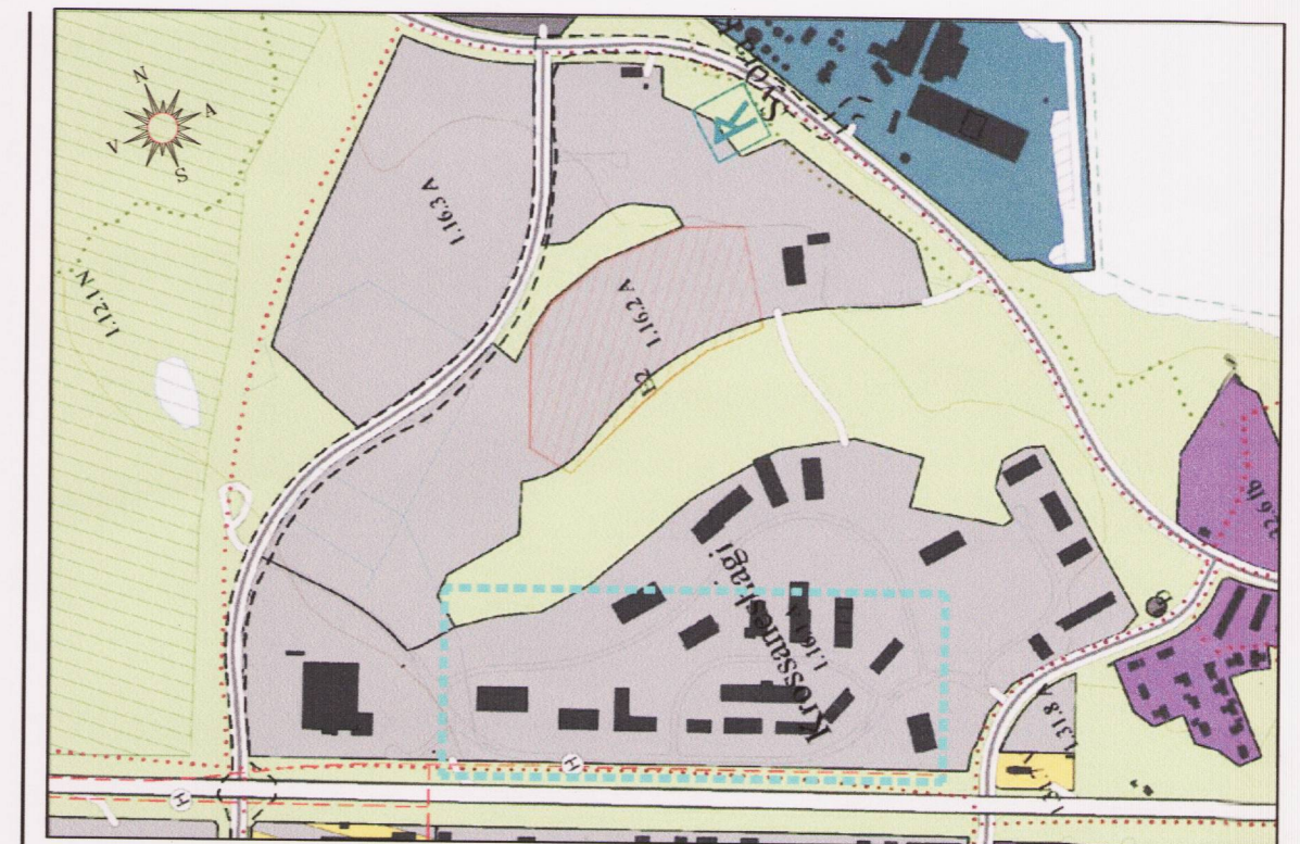
Aðalskipulag Akureyrar 2005 - 2018 - mkv. 1:10.000

4.4.4. Lóðir og lóðafrágangur (texti úr kallanum sem tekur breytingum) Á eftirtöldum lóðum við Baldursnes nr. 2, 4, 6, 8, og við Njarðarnes 1, 2, 9 og 14 er annars vegar kvöð um bundna byggingarlínu og hins vegar kvöð um 3.0 m breiðan göngustíg meðfram ofangreindum húsum og að lóðarmörkum beggja vegna (hvers húss). Með bundinni byggingarlínu er átt við að bygging skulu snerta byggingarlínuna að einhverju eða öllu leyti. Stígurinn er á kostnað lóðarhafa. Eftir lóðarmörkum sömu lóða eru með kvöð um bindandi byggingarlínu skal planta a.m.k. einu tré á hverja 5 m. Plantað verði a.m.k. 3 m háum lautrjám og a.m.k. 1.5 m háum sigrænum trjám í jöfnu hlutfalli. Tegundum skal blanda saman.