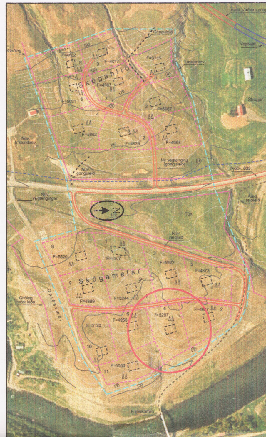
Yfirlitsmynd gildandi deiliskipulag - mkv. 1:4000