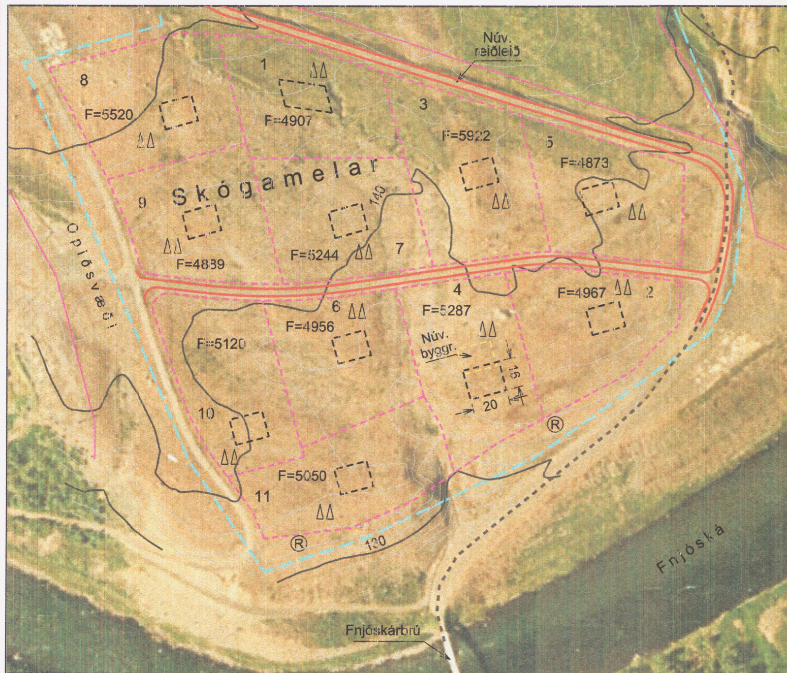
Breytt deilisk. - mkv. 1:2000