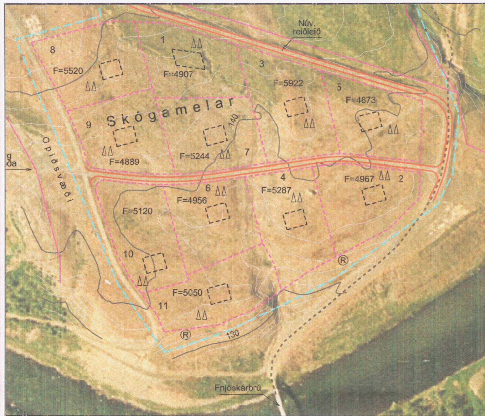
Úrklippa úr gildandi deiliskipulagi - mkv. 1:2000 samþ. 14. mars 2011