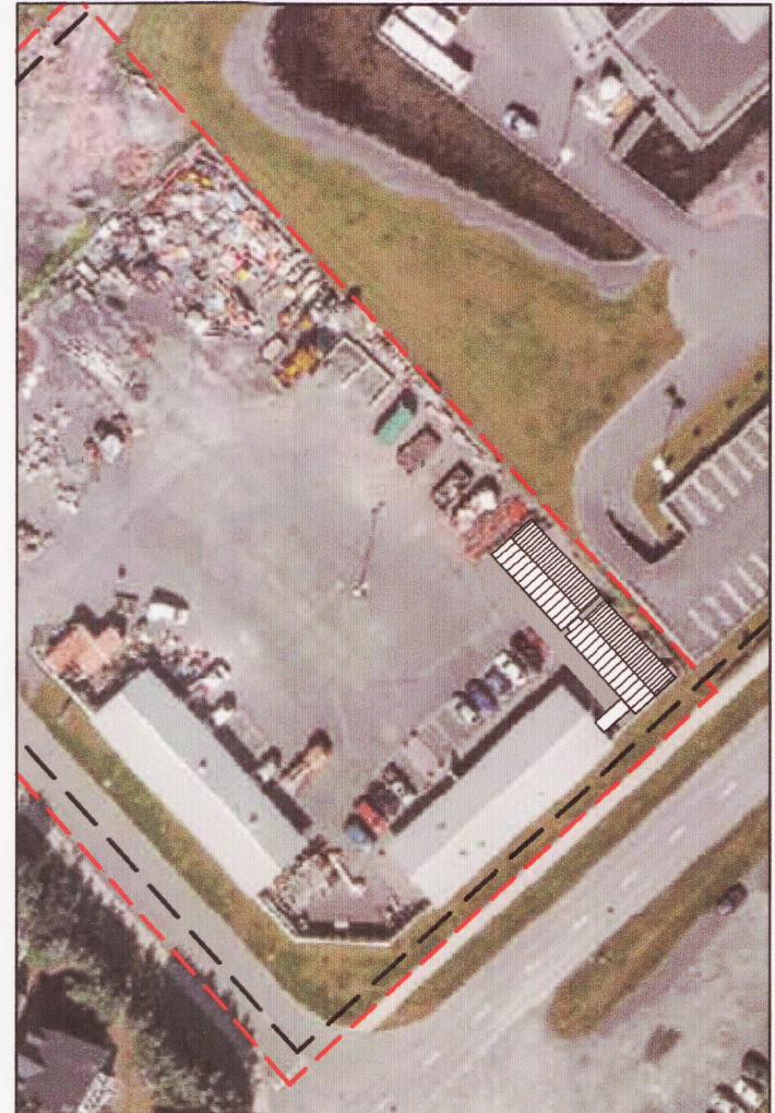
Skýringarmyndir: Loftmyndir með mögulegum staðsetningum færarlegra húsa MKV. 1:1000

2. Auglýst breyting á gildandi deiliskipulagi sem er auglýst, þ.e. veruleg breyting: Deiliskipulagsbreyting þessi sem fengið hefur meðferð í samræmi við ákvæði 1. mgr. 43. gr. skipulagslaga nr. 123/2010 var samþykkt í Borgarráði þann 18.6.2015 og embætti skipulagsráðgjafar þann 23.8.2015. Tillagan var auglýst frá 30.6.2015 með athenasemdafrest til 12.8.2015. Auglýsing um gildistöku breytingarinnar var birt í B-deild Stjórnartíðinda þann 20.8.2015.