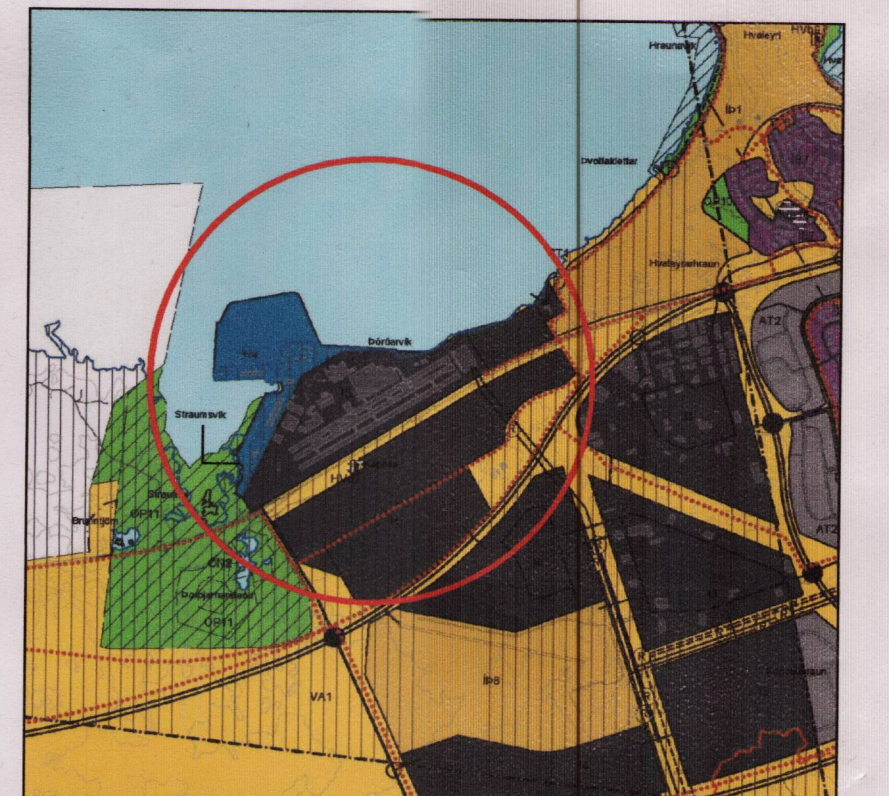
HLUTI AF ABALSKIPULAGI HAFNARFJARÐAR 2013 - 2025