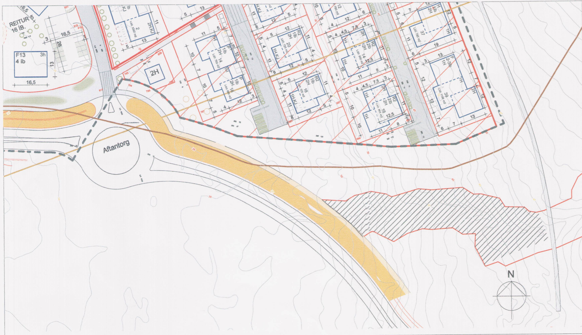
BREYTT DEILISKIPULAG SKARÐSHLÍÐAR, 3. ÁFANGI. MKV. 1:1000