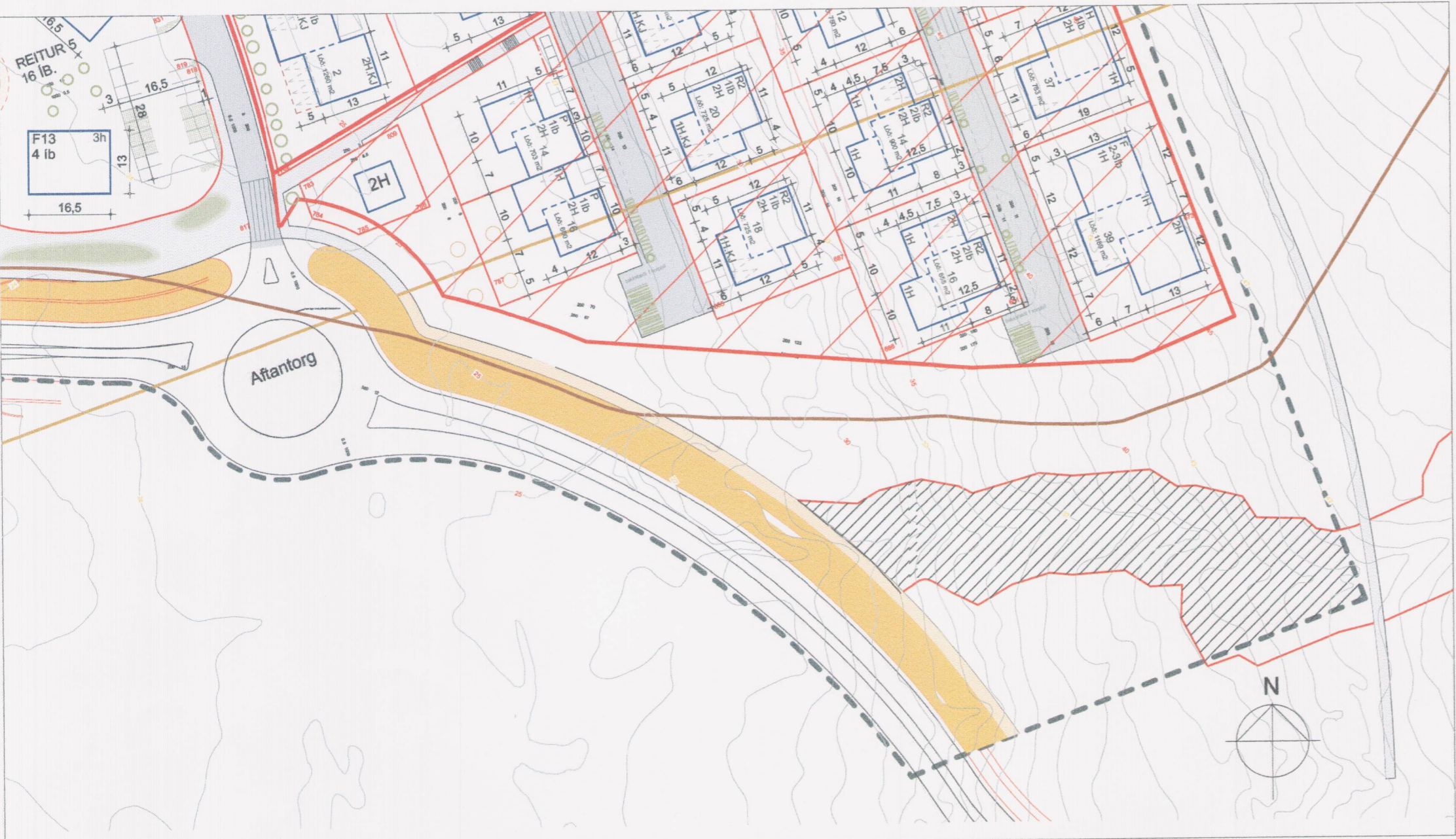
DEILISKIPULAG SKARÐSHLÍÐAR, HLTAMYND. MKV. 1:1000. SAMÞYKKT 03.04.2018