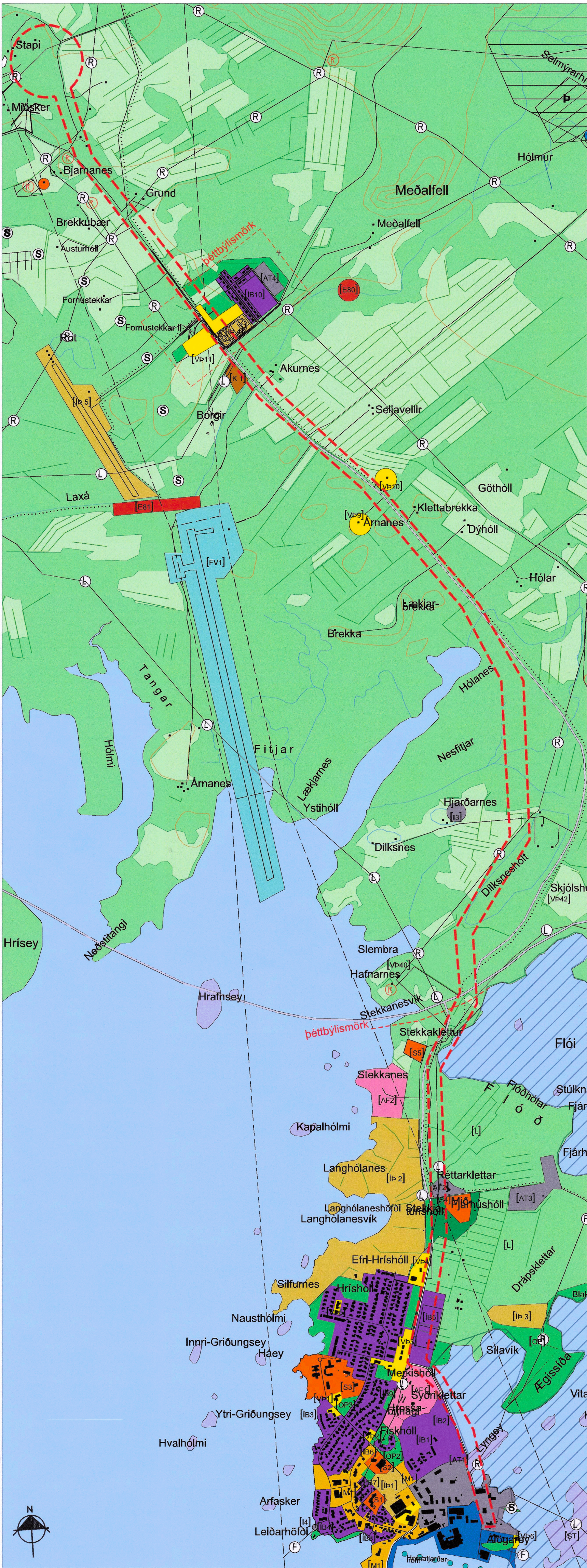
Gildandi uppdráttur - mkv. 1:15.000