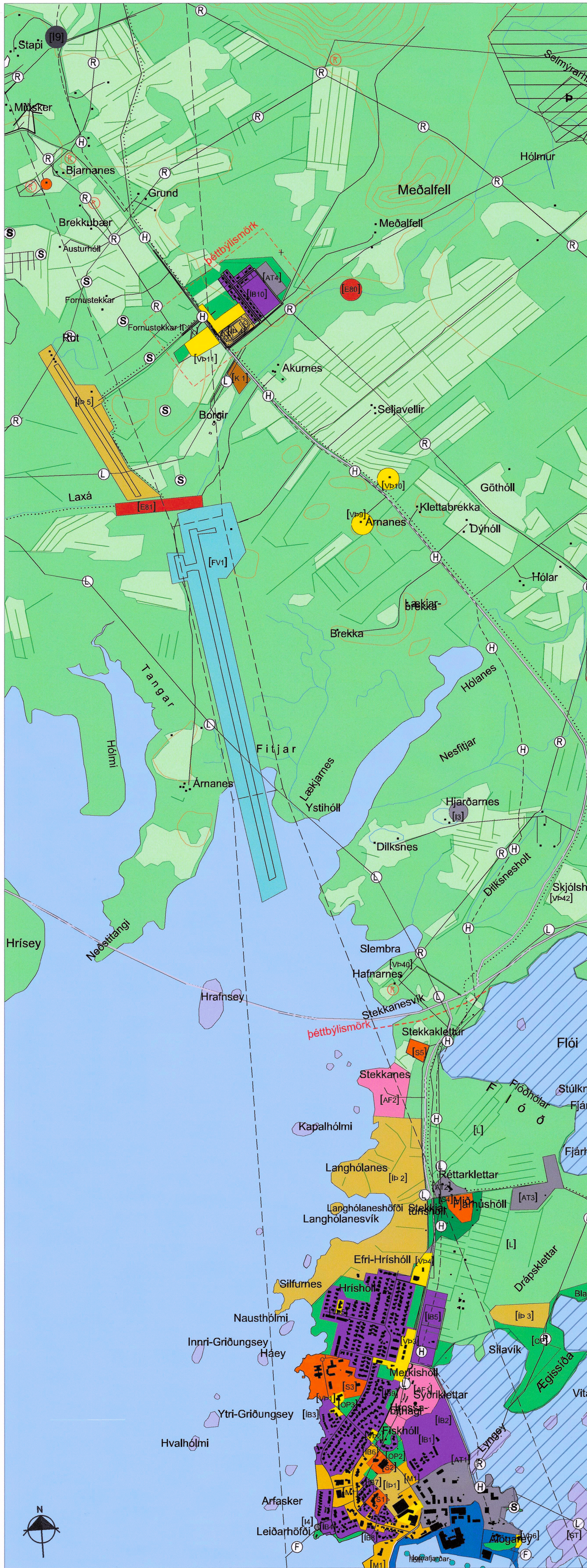
Uppdráttur eftir breytingu - mkv. 1:15.000