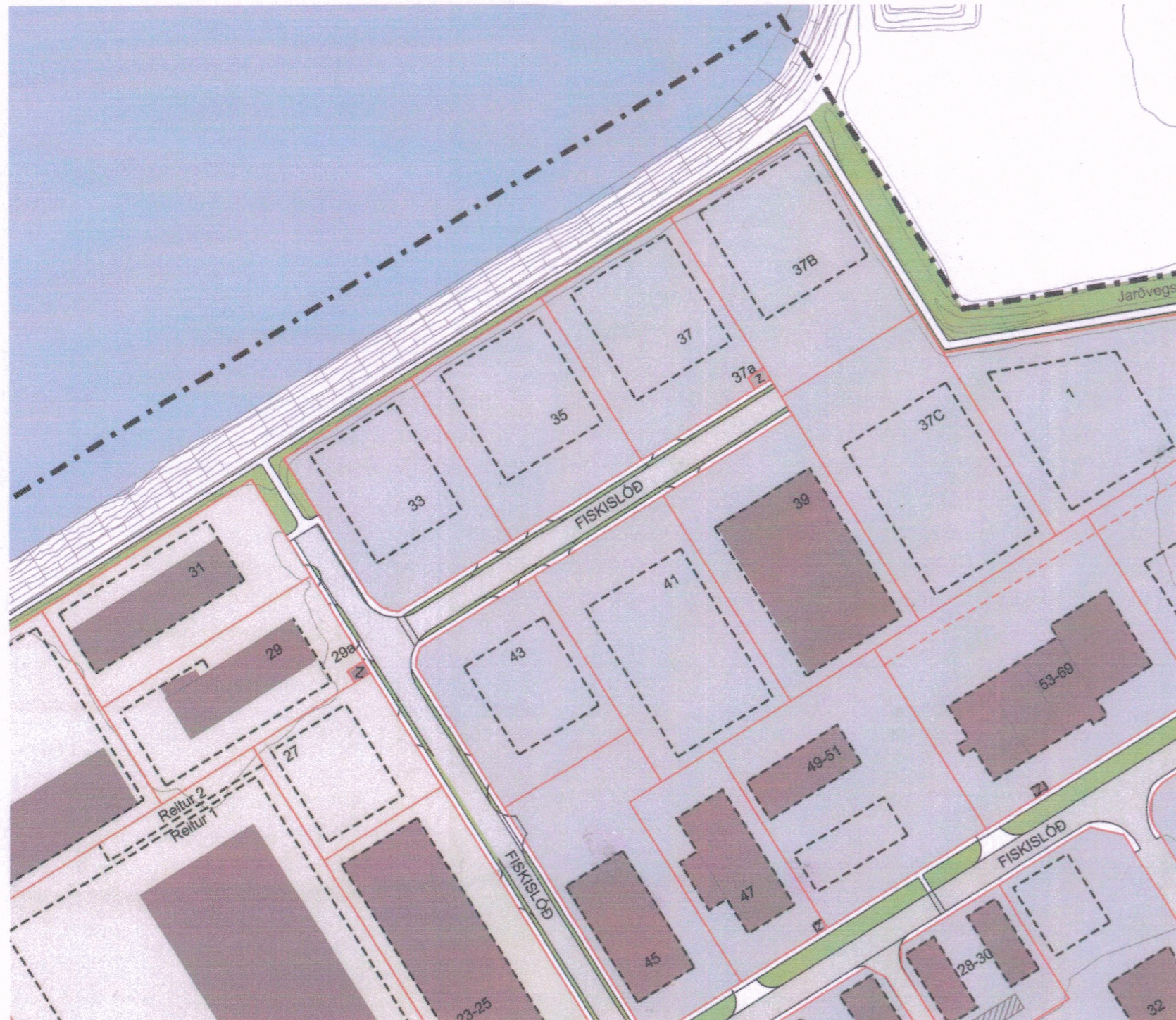
Gildandi deiliskipulag - 1:2000 Samþykkt í Borgarráði 3.11.2015.