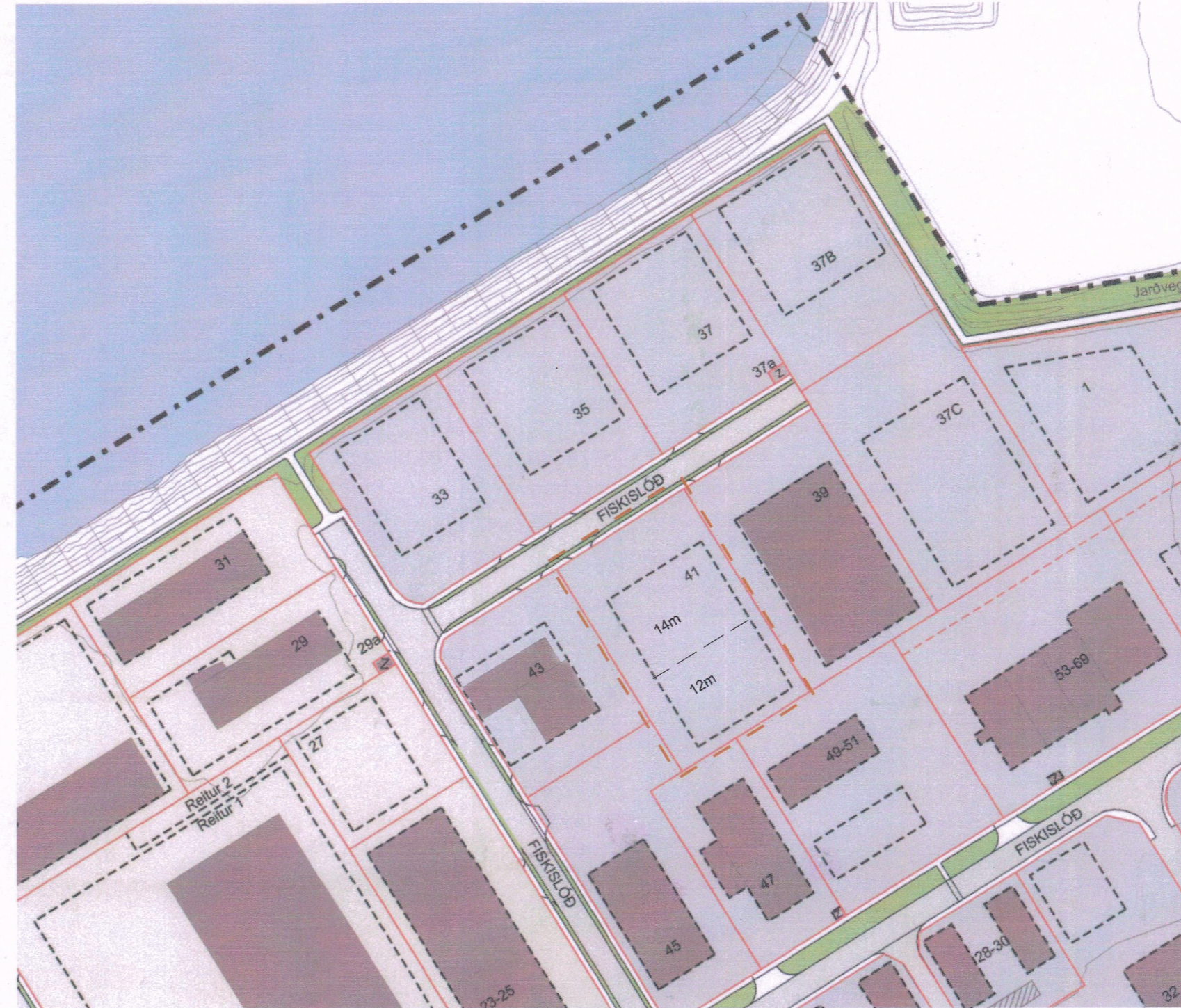
Tillaga að breytingu á deiliskipulagi - 1:2000

Breytingar á deiliskipulagi fyrir Fiskislóð 43