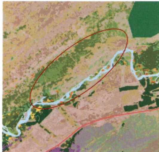
MYND 1. Vistgerðarkort NÍ – rauður hringur sýnir skipulagssvæðið (Náttúrufræðistofnun Íslands 2020).

Svæðið er gróðurryrt, sandorpið hraun, flatlent en hallar lítið eitt að Ytri – Rangá. Samkvæmt vistgerðarkortlagningu Náttúrufræðistofnunar Íslands (2020) teljast eftirtalin vistlendi á svæðinu; eyðimelavist (L1.1), grasmelavist (L1.2), lyngmóavist á láglendi (L10.8), starmóavist (L10.3), melagambravist (L5.2) og grasengjavist (L9.5), sjá mynd 1. Verndargildi vistgerðanna er miðlungs eða lágt nema fyrir grasengjavist sem er með hátt verndargildi og er á lista Bernarsamningsins yfir vistgerð sem þarfnast verndar. Vistgerðin finnst á láglendi í öllum landshlutum og er algengust á víðáttumiklu, uppgrónu framburðarlandi með ám og fljótum (Náttúrufræðistofnun Íslands, 2016). Hafa ber í huga nákvæmni vistgerðarkortlagningar við mat á vistgerðum svæðisins en kortlagning miðast við nákvæmni 1:25.000.