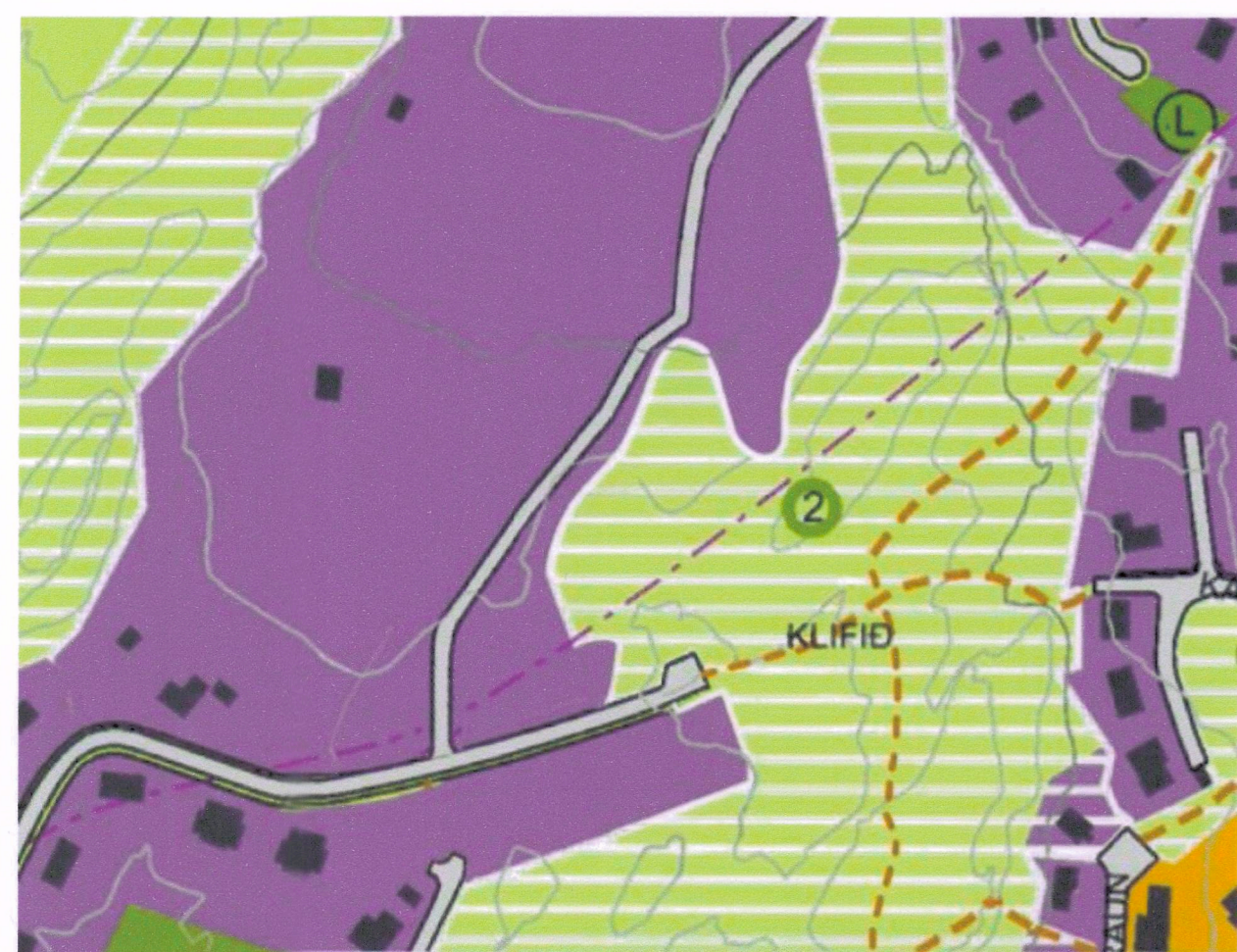
Aðalskipulag Djúpavogshrepps 2008 - 2020