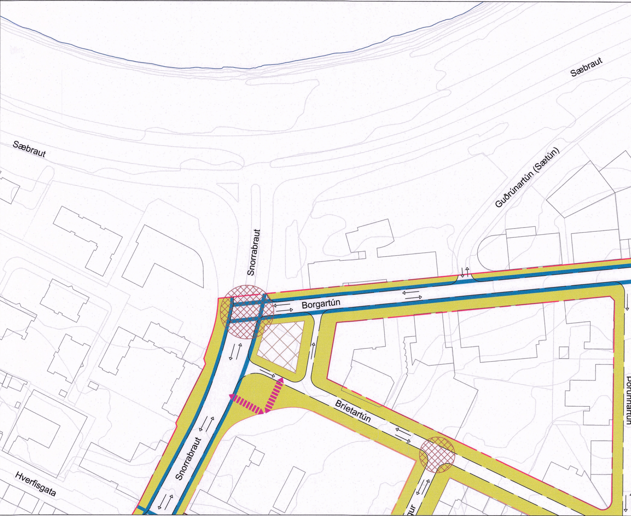
Hluti gildandi skipulagsuppráttar, samþykktur 19.03.2020 og tók gildi 07.04.2020 1:1000

*Staðsetning tákns fyrir stíga á uppdrætti (punktalini), meðfram stofn- og tengi-brautum og öðrum götum er ekki ráðandi um hvoru megin götu stígar liggur.