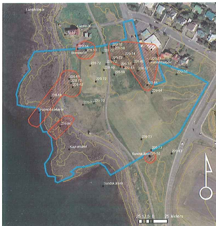
Mynd 4. Verndarsvæði og minjastaðir (Minjasafn Reykjavíkur, 2009).

Samkvæmt Aðalskipulagi Reykjavíkur 2001-2024 eru skráðar fornminjar á svæðinu. Í tengslum við deiliskipulagsbreytinguna og fyrirhugaðar framkvæmdir var unnin sérstök fornleifaskráning á skipulagssvæðinu. Skráningin var unnin af Minjasafni Reykjavíkur í maí og júní 2009 og er skýrsla nr. 145.