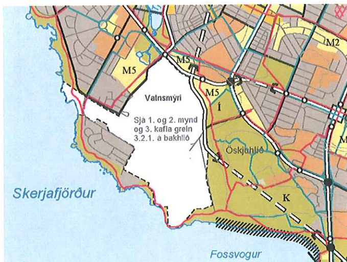
Mynd 2. Hluti Aðalskipulags Reykjavíkur 2001-2024 (Reykjavíkurborg, 2002)

Skipulagssvæðið sem um ræðir er skilgreint sem opið svæði til sérstakra nota í Aðalskipulagi Reykjavíkur 2001-2024 (Reykjavíkurborg, 2002). Einnig fellur skipulagssvæðið innan Vatnsmýrarinnar sem er helgunarsvæði helgunarsvæðis Reykjavíkurflugvallar.