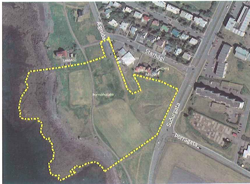
Mynd 1. Yfirlitsmynd - Mörk skipulagssvæðis (Teiknistofan Stord ehf, 2009).

Skipulagssvæðið sem hér um ræðir er 5 ha er opið svæði til sérstakra nota sunnan við Starhaga og vestan við Suðurgötu.