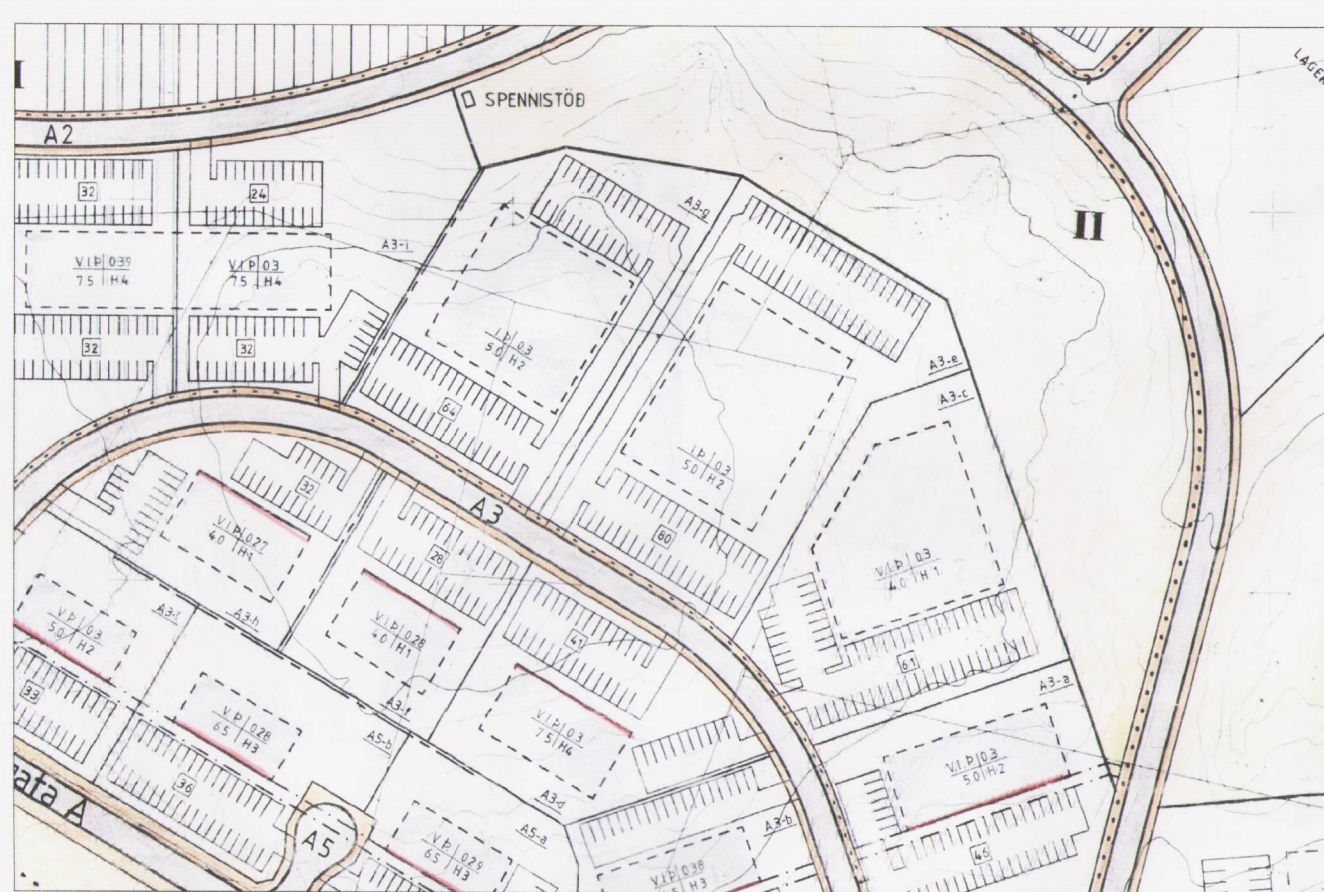
Gildandi deiliskipulag - mkv. 1:2000