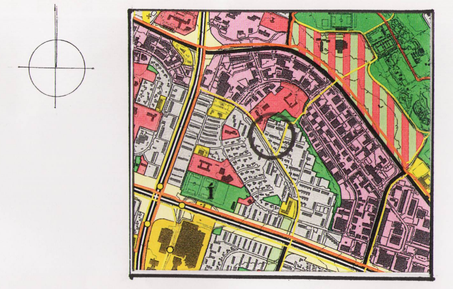
Hluti Aðalskipulags Reykjavíkur 1996 - 2016