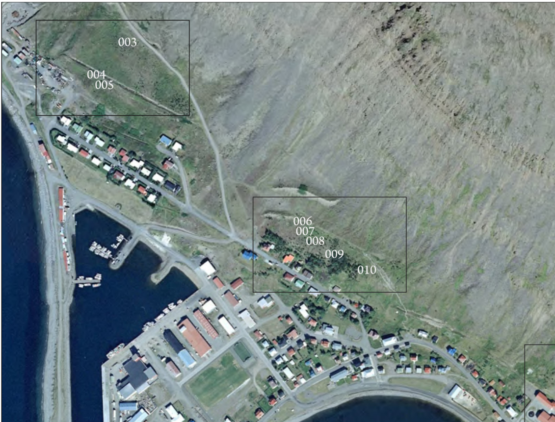
Mynd 2. Skráningarsvæðin 2014. Fornleifar nr. 003 eru nú utan við framkvæmdasvæðið/skoðunarsvæðið (Margrét Hrönn Hallmundsdóttir 2014, kort 1).

Minjastofnun Íslands hafði farið fram á að sjö fornleifanna sem skráðar voru 2014 yrðu rannsakaðar, en síðar var ákveðið að nægilegt væri að rannsaka fimm og þrjár þeirra eru innan könnunarsvæðisins sem nú var kannað. Hinar tvær (af þremur) eru vestast á svæðinu og mótvægisáðgerðir eru yfirstaðnar þar eins og að framan greinir.