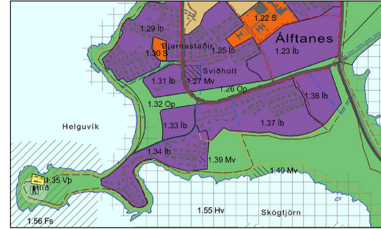
Áðalskipulag Garðabæjar 2016-2030

Hluti af deiliskipulagi þessu er deiliskipulagsgreinargerð dags. 04.04.2019 og Teikning 111 Sníð - Breiðamýri