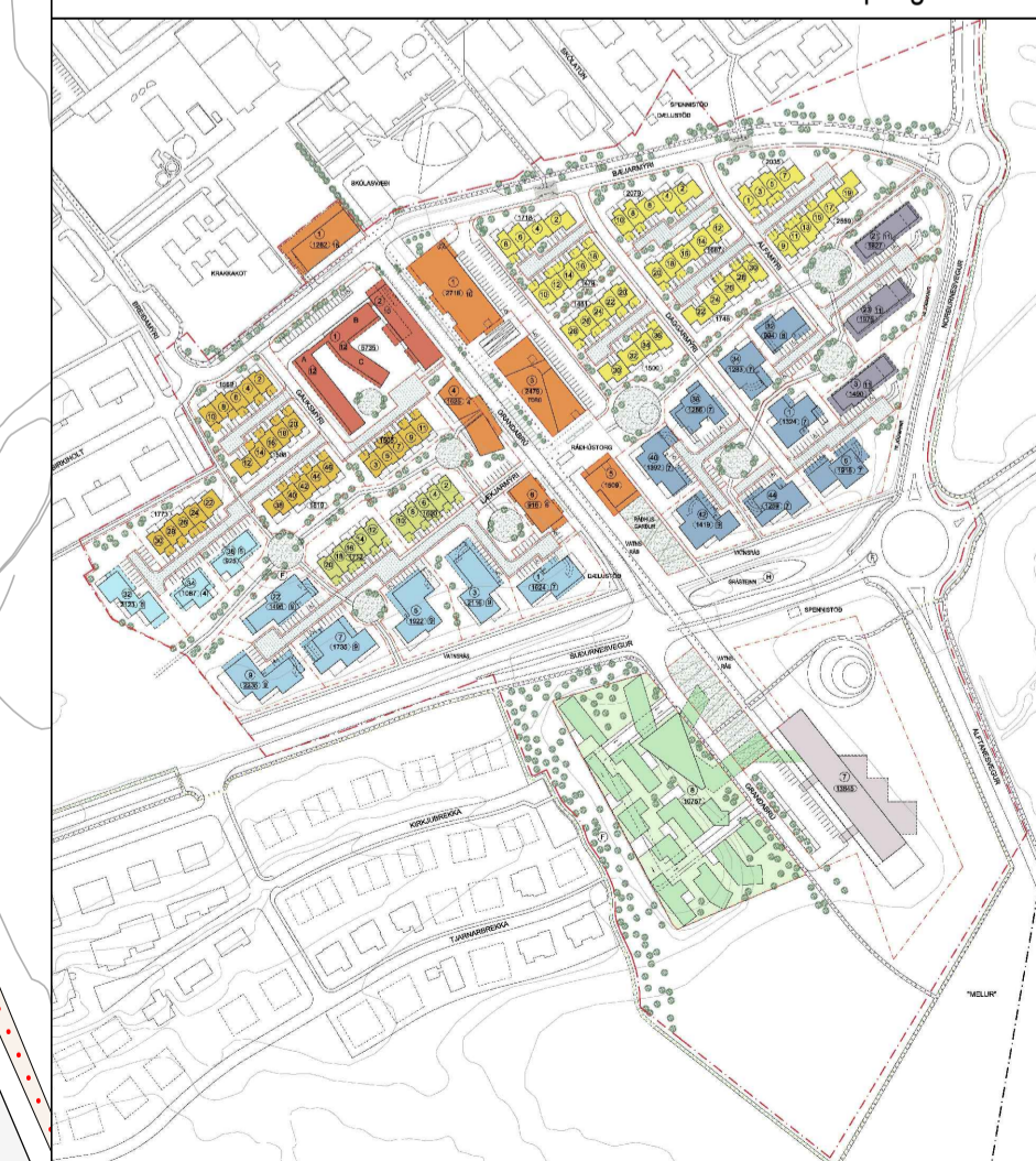
Skipulag sem fellur úr gildi 1:5000