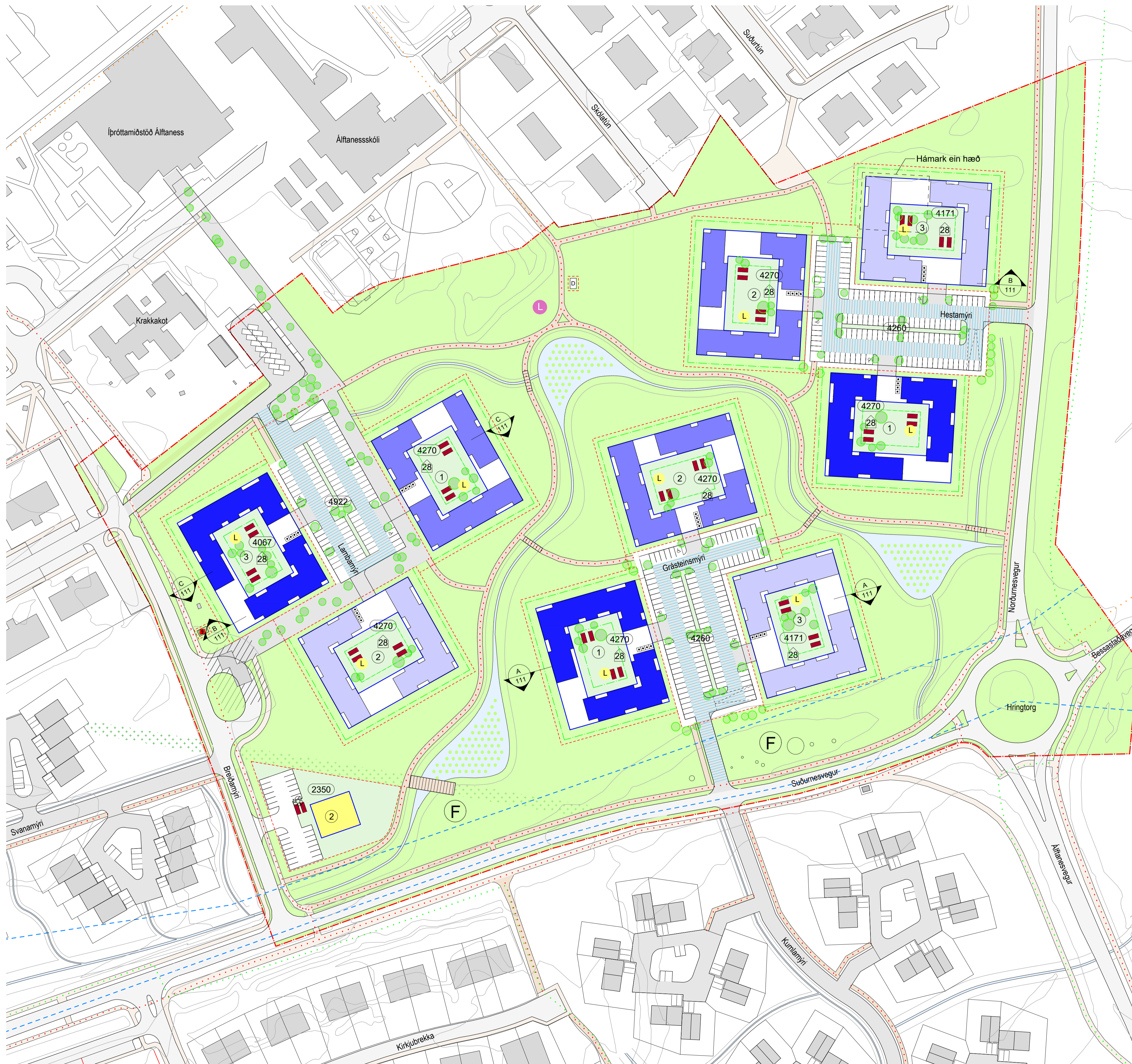
0 50 m

Deiliskipulag fyrir Álftanes, Miðsvæði og Suðurnes