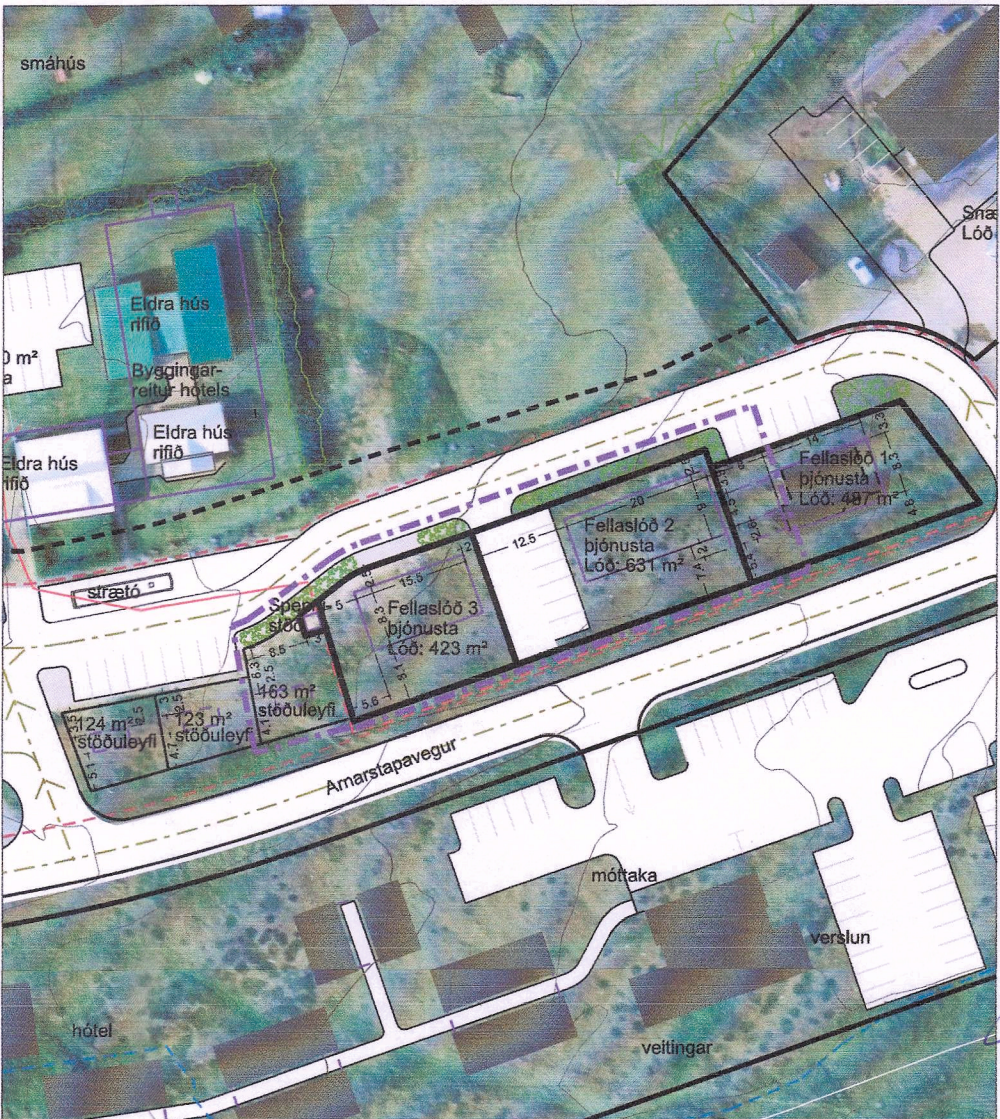
Deiliskipulag eftir breytingu, mælikvarði 1 : 1.000