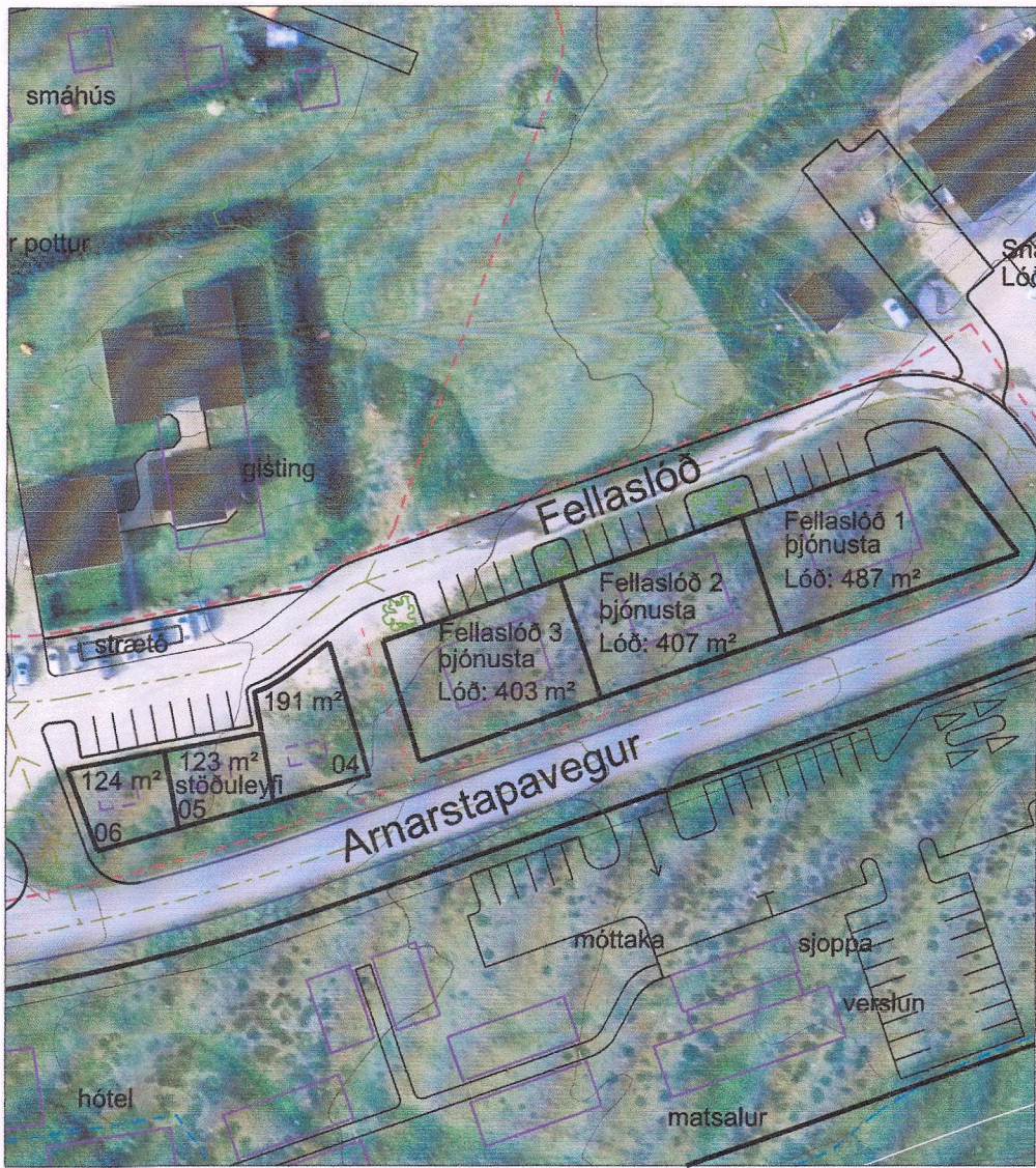
Deiliskipulag fyrir breytingu, mælikvarði 1 : 1.000 Deiliskipulag verslunar og þjónustu við Fellaslóð, Arnarstapa, samþykkt/staðfest 07.04.2016