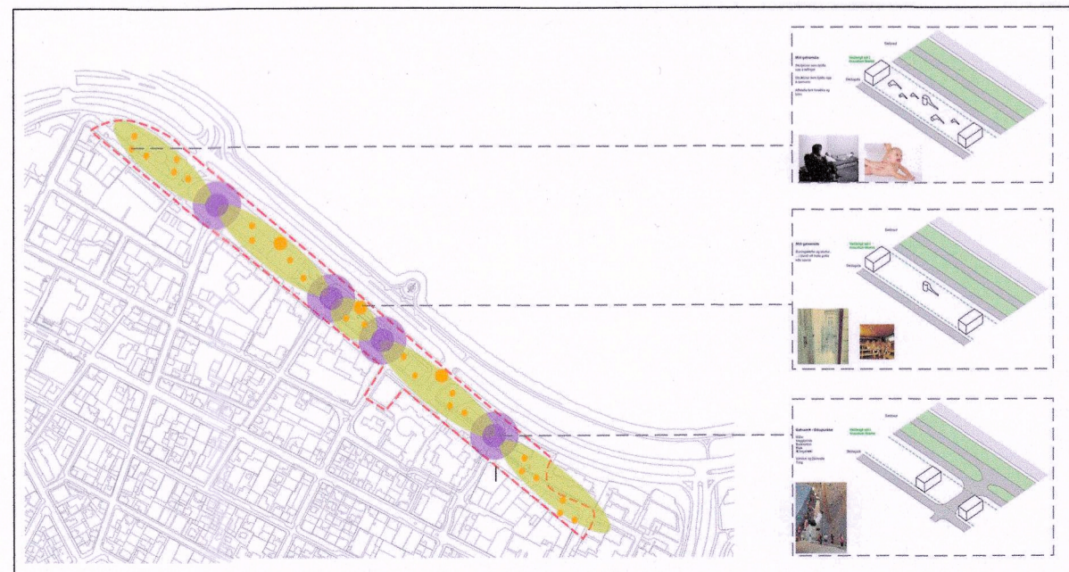
SVÆÐI MILLI SKÚLAGÖTU OG SÆBRAUTAR - HEILDARSÝN

MÆLIÐLAÐ AF NÚVERANDI AÐSTÆÐUM Á SKÚLAGÖTU 11