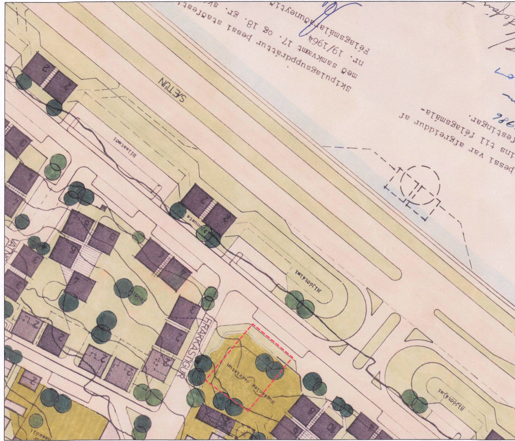
GILDANDI DEILISKIPULAG FRAKKASTÍGS 1, mkv. 1:1000 - samþykkt 13.05. 1986