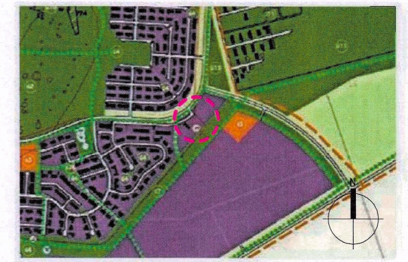
Yfirlitsmynd - aðalskipulag Árborgar 2005-2025 (Ekki í Mkv)

Að öðru leiti gilda skipulagsskilmálar gildandi deiliskipulags.