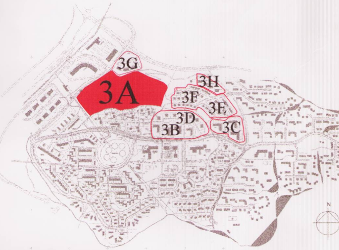
Yfirlitsmynd af Grafarholti