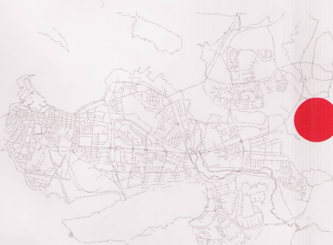
Aðalskipulag Reykjavíkur 1996-2016