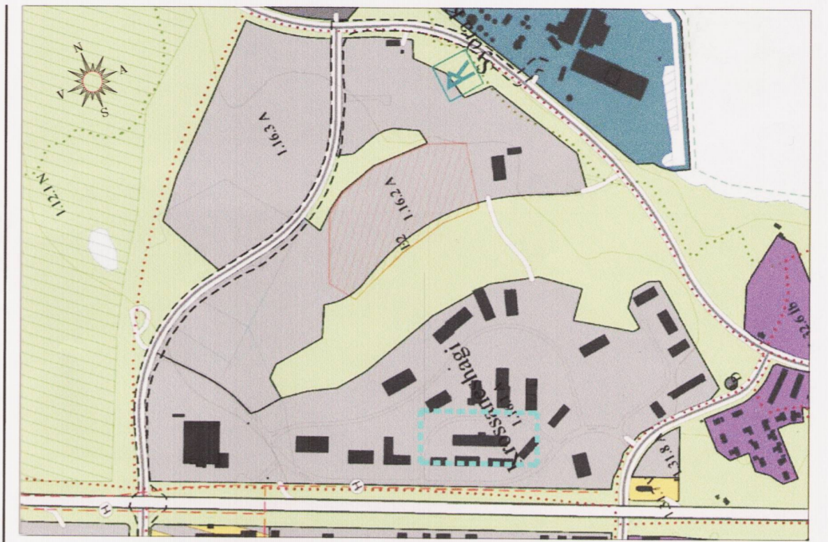
Aðalskipulag Akureyrar 2005 - 2018 - mkv. 1:10.000

Að öðru leyti gildir áfram deiliskipulag ásamt greinargerð sem tók gildi í B-deild þann 21. júlí 2007 ásamt síðari breytingum.