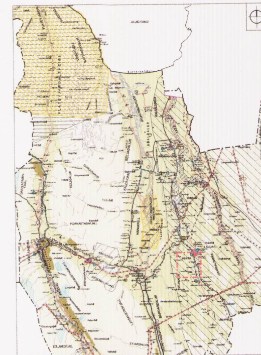
Hluti af Aðalskipulagi Þingeyjarsveitar 2010-2022 - - - Svæði sem breytingin nær yfir