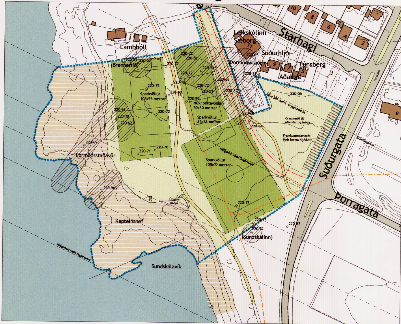
Gildandi deiliskipulag fyrir Starhaga - Þormóðsstaðaveg Gildandi deiliskipulagsuppdáttur samþykktur í borgarráði 10. september 2009