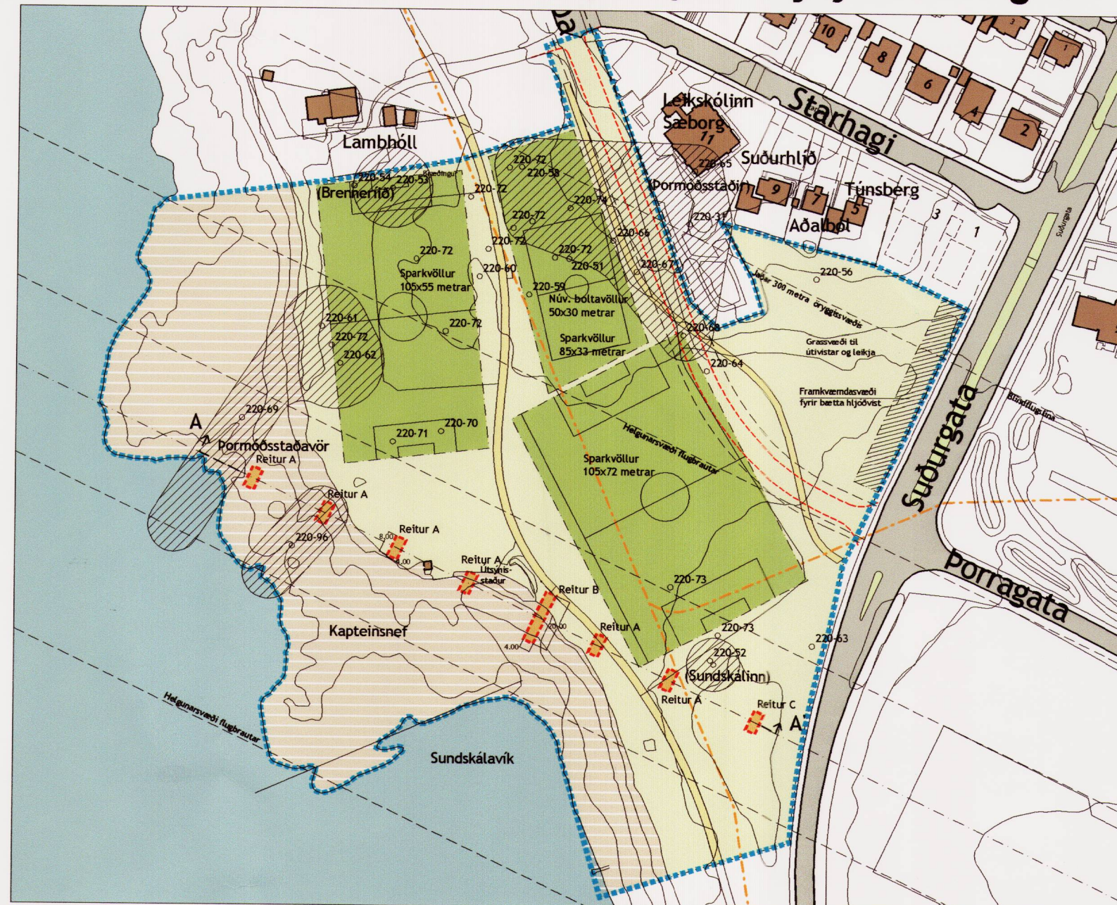
Deiliskipulagsbreyting fyrir Starhaga - Þormóðsstaðaveg Aðflugsliós fyrir Reykjavíkflugvöll