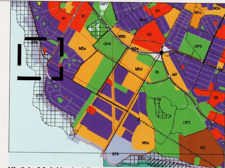
Hluti úr Aðalskipulagi Reykjavíkur 2010-2030