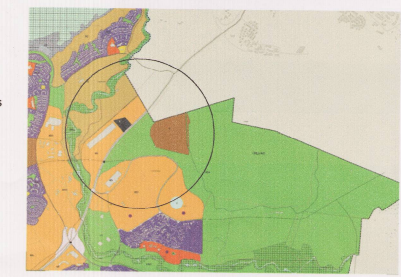
Hluti af Aðalskipulagi Reykjavíkur 2010 - 2030

Deiliskipulagsbreyting þessi, sem fengið hefur meðferð í samræmi við ákvæði 2. mgr. 43 gr. skipulagslaga nr. 123/2010, var samþykkt í/á Umhverfis- og skipulag þann 10. janúar 2018 . Til samræmis við heimild í 3. mgr. 44. gr. í.f. var breytingin ekki grenndarkynnt þar sem hún varðaði ekki hagsmunum annarra en Reykjavíkurborgar og/eða umsækjanda. Auglýsing um gildistöku breytingarinnar var birt í B-deild Stjórnartíðinda þann 1. mars 2018 .