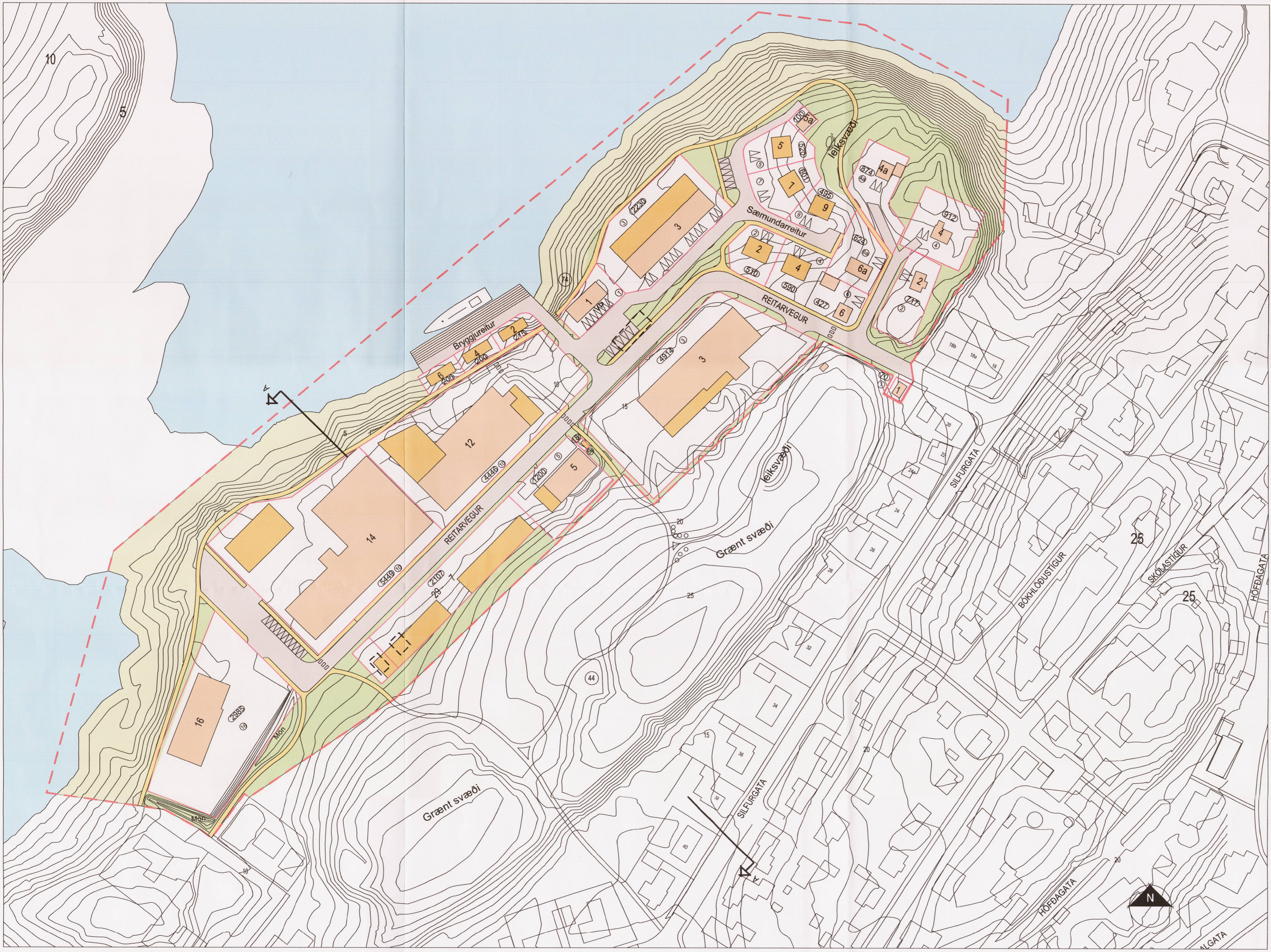
SKÝRINGARUPPDRAÐTUR A1 - 1:1000