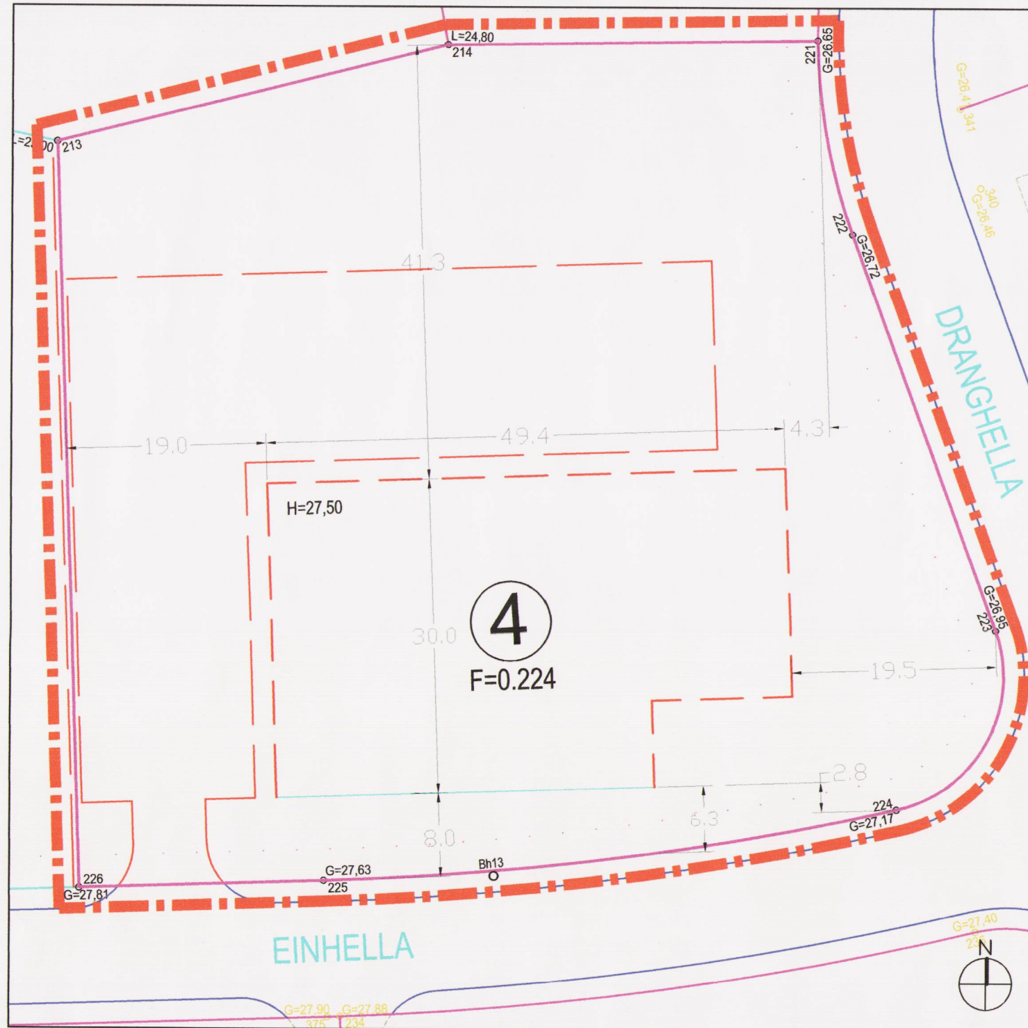
FYRIR BREYTINGU - Í GILDI FRÁ _____ MKV 1:500