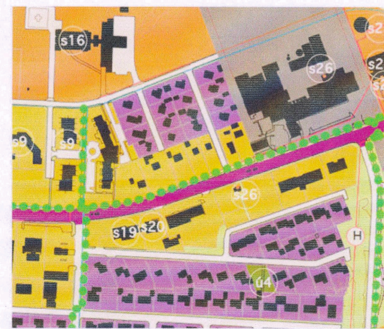
HLUTI AÐALSKIPULAGS ÁRBORGAR 2010-2030