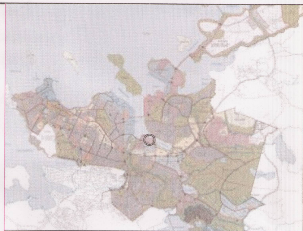
ADALSKIPULAG REYKJAVÍKUR 2001-2004