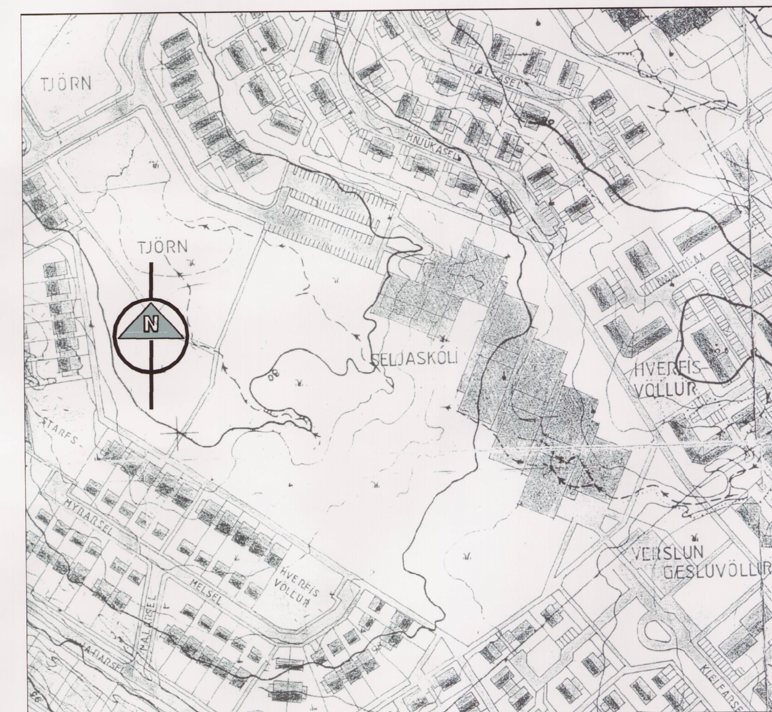
Hluti af deiliskipulagi Seljahverfis samþ. í borgarráði 20.12.1977 Uppfært í september 1986

Engar athugasemdir bárust vegna tillögunnar á auglýsingatíma og var hún því afgreidd endanlega á afgreiddumfundum skipulagsfulltrúa þann 13. apríl 2005.