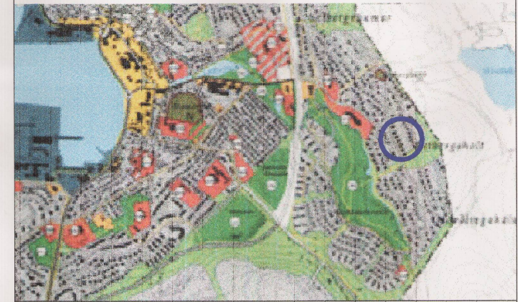
HLUTI AÐALSKIPULAGS HAFNARFJARÐAR 1995-2015

Byggingarreiturinn stækkar um 4,0 m til norðurs. Stækkar grunnflötur hússins um 35,0 m 2 við það. Stærð íbúðarhúss verður um 254,6 m 2 . Nýtingarlutfall lóðar Klettbergs 42 verður um 0,52 eftir þessa breytingu og Klettbergs 44 um 0,59. Að öðru leyti gilda skilmálar dags. 11.01.1999. Bæjarstjórn Hafnarfjarðar lýsir því yfir að bætt verði sannanlegt tjón er einstaka aðilar kunni að verðar fyrir við breytinguna.