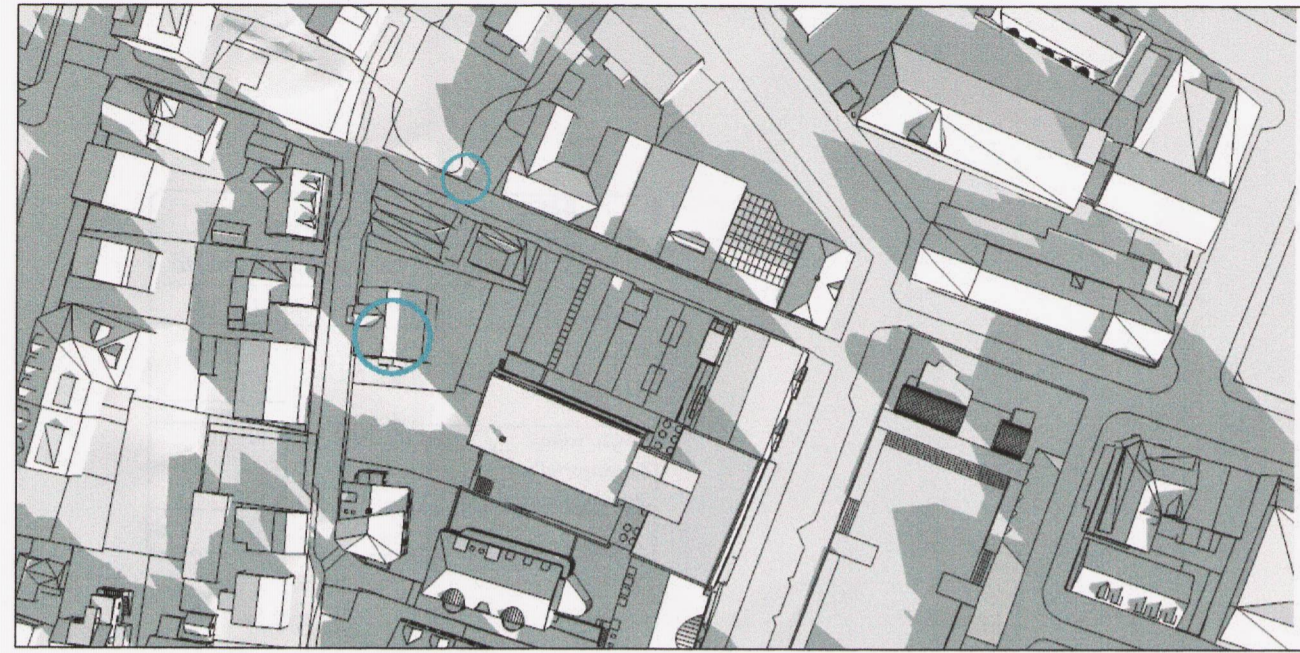
Núverandi skuggavarp 21. júní kl. 10