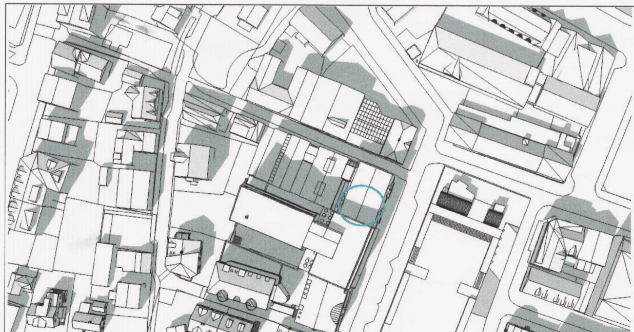
Núverandi skuggavarp mars kl. 14