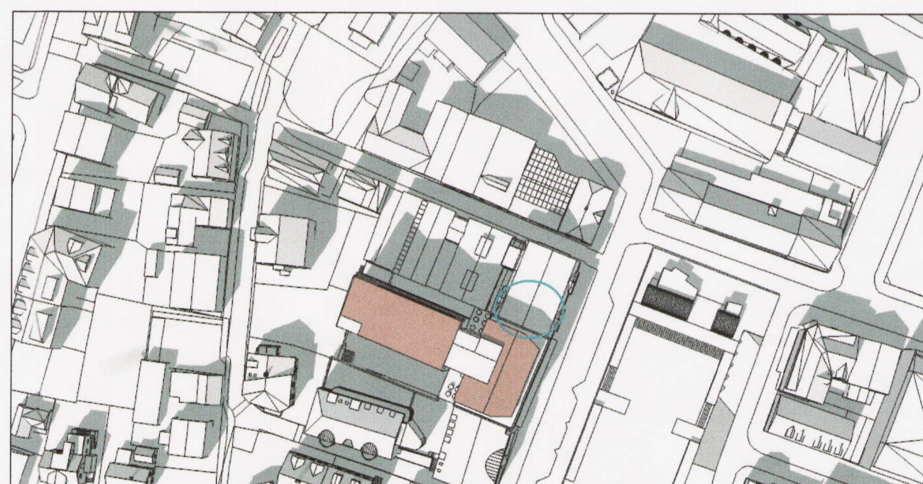
Deiliskipulagstillaga skuggavarp mars kl. 14