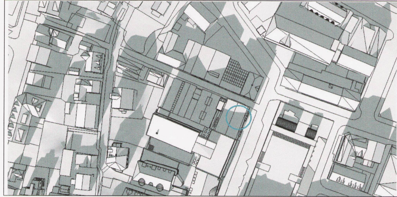
Núverandi skuggavarp 21. júní kl. 14