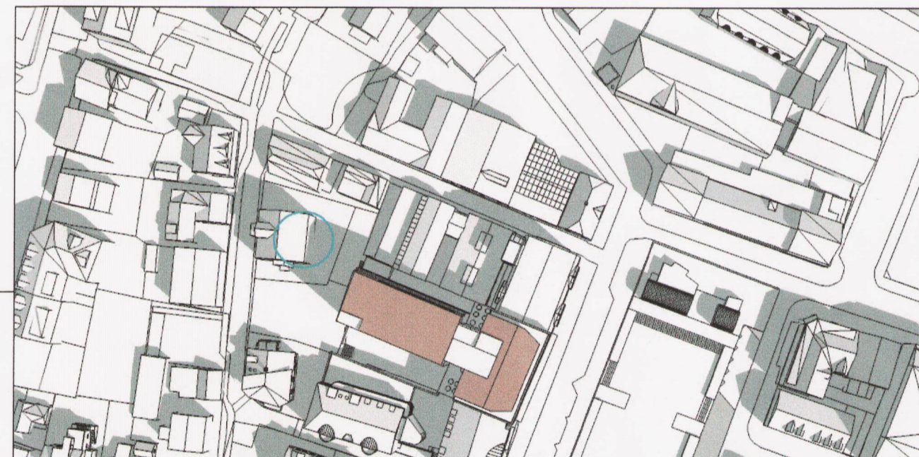
Deiliskipulagstillaga skuggavarp mars kl. 10