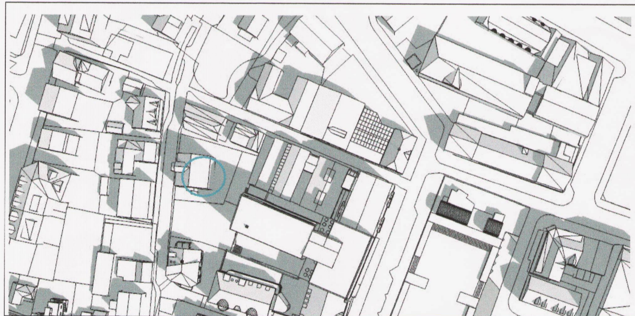
Núverandi skuggavarp mars kl. 10