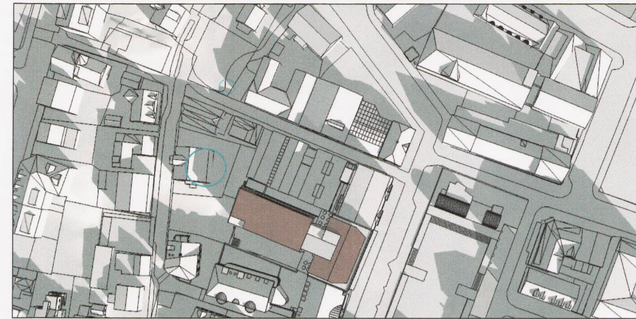
Deiliskipulagstillaga skuggavarp 21. júní kl. 10